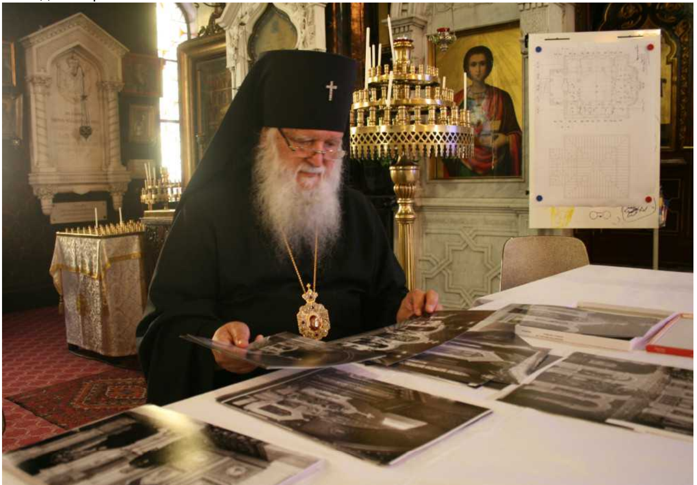
Архиепископ Женевский и Западно-Европейский Михаил показывает архивные фотографии собора

«Забота о восстановлении облика церкви – наш долг. Это нормально и естественно. Еще в 2010-м году мы думали, что к 150-летию у нас будет полностью обновленный храм, что он предстанет во всем своем блеске и великолепии. К сожалению, этого не получилось. Мы не будем опускать руки. Понятно, что реставрация сильно затянется, но она не прекратится», - заверил Нашу Газету.ch архиепископ Женевский и Западно-Европейский Михаил.