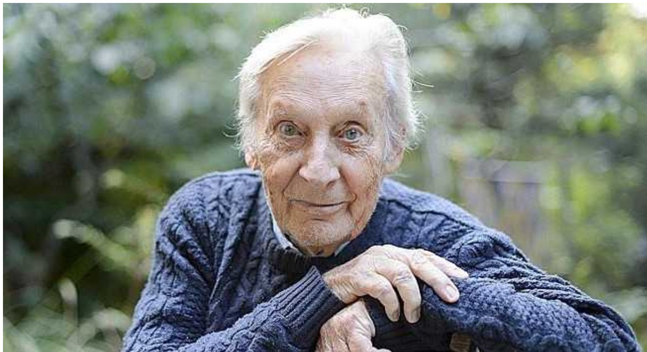
Жан Мор