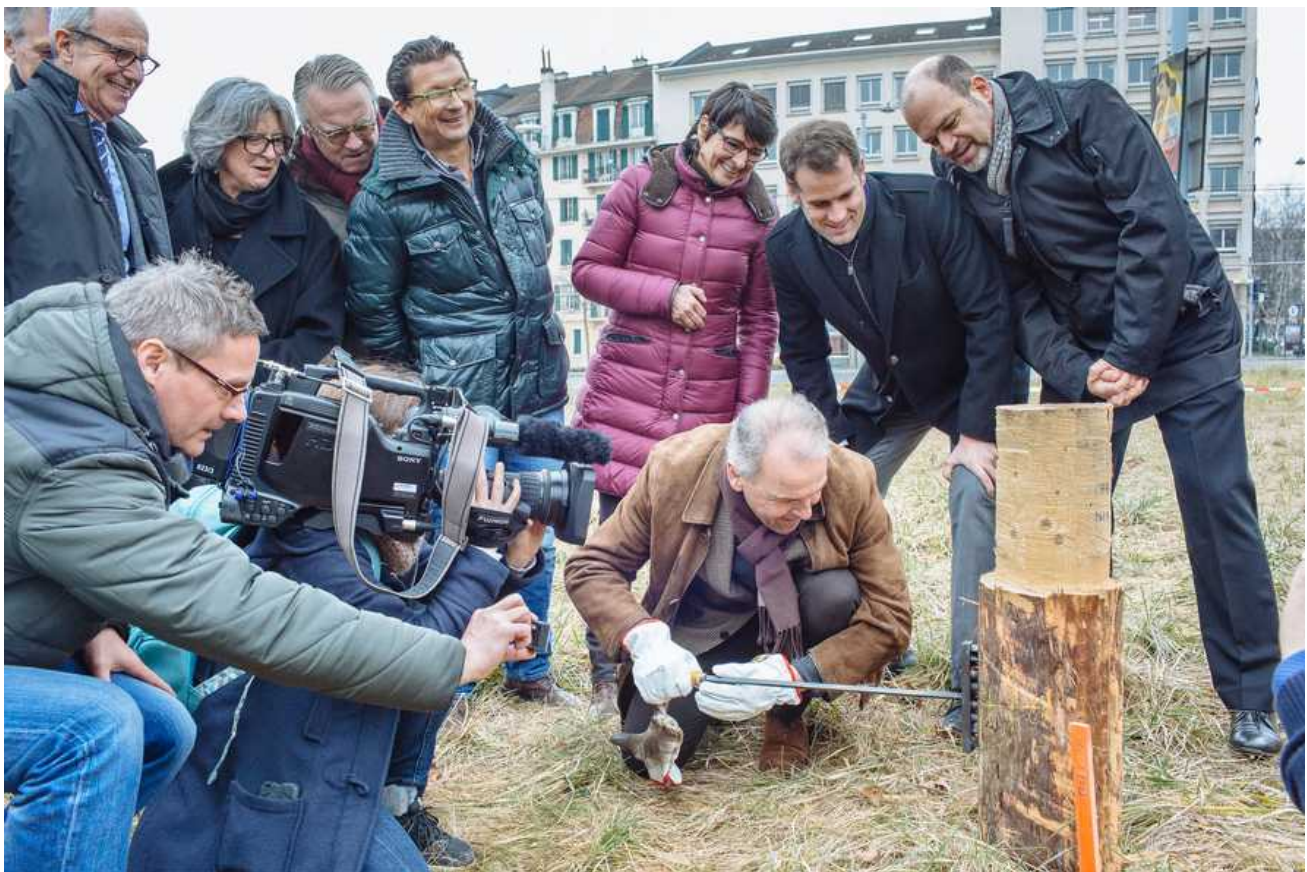
Первый колышек вбит!

Для того, чтобы как можно более полно соответствовать нуждам и постановок, и тех, кто в них участвует, базовая структура будет расширена, переделаны сцена и ярусы, добавлена оркестровая яма. В здании должны будут разместиться также гримерные артистов и технические помещения. Вместимость существующего зала также возрастет – с 750 до 1064 мест, то есть всего на 400 мест меньше, чем в сегодняшнем Большом театре.