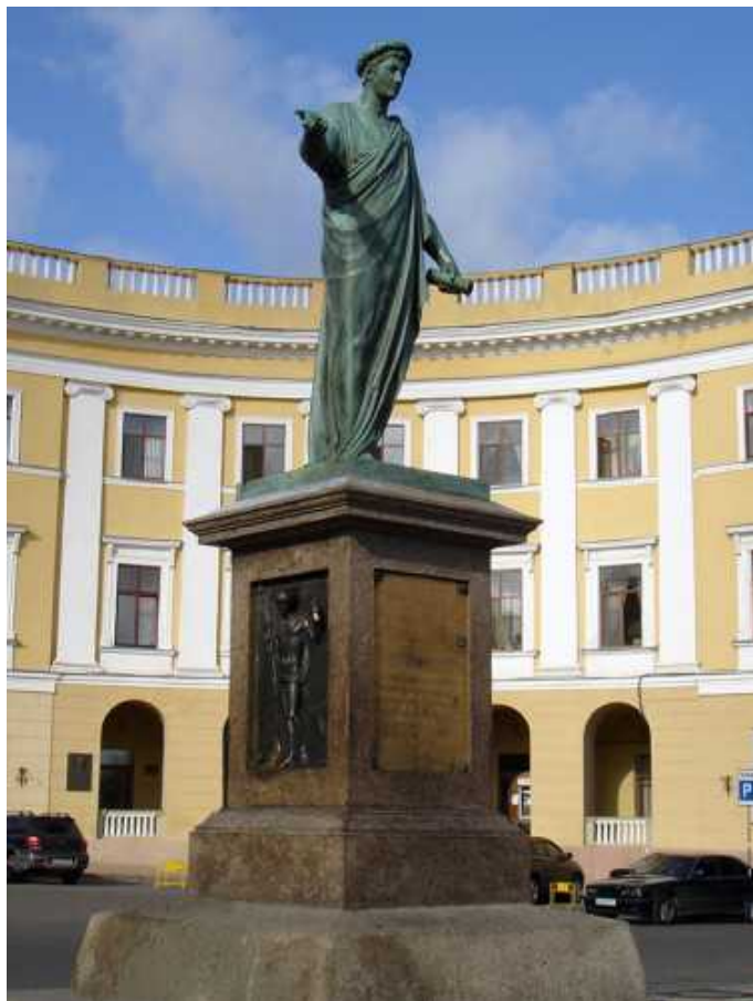
Памятник дюку де Ришелье в Одессе

В письмах Шарля-Рене содержится немало фактов, рассказывающих не только о событиях тех дней, но и о нравах общества, окружавшего молодого женева. Главным развлечением молодого человека была охота, которую время от времени устраивали его знакомые. Он также посещал своеобразные «мальчишники» жившего холостяком герцогом Ришелье и находил приятным и интересным узкий круг его друзей.