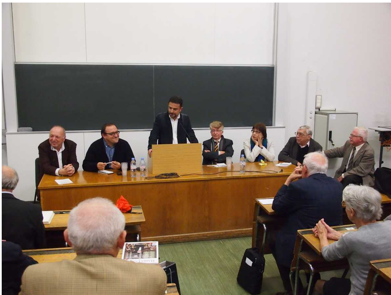
Заключительная дискуссия в Женевском

Auteur: Надежда Сикорская, Женева , 07.11.2014.