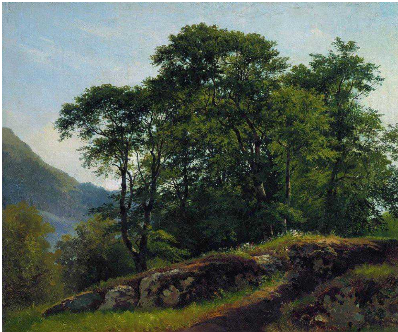
Иван Шишкин. Буковый лес в Швейцарии. 1863 год

Auteur: Азамат Рахимов, Женева , 18.12.2014.