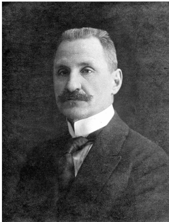
С.А. Бутурлин. Москва, 1918 г.