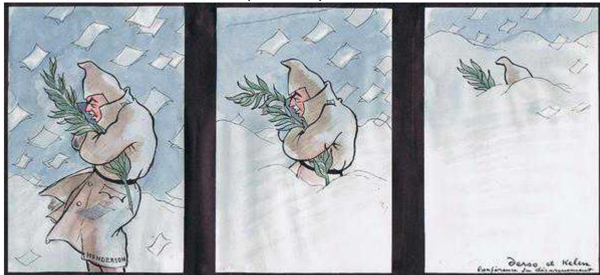
Артур Гендерсон, заваленный резолюциями

Немало карикатур было посвящено Всемирной конференции 1932 года по вопросам разоружения. На одной из них вы видите ее председателя Артура Гендерсона, английского политического деятеля, который постепенно исчезает, как под снегопадом, под листопадом принятых резолюций.