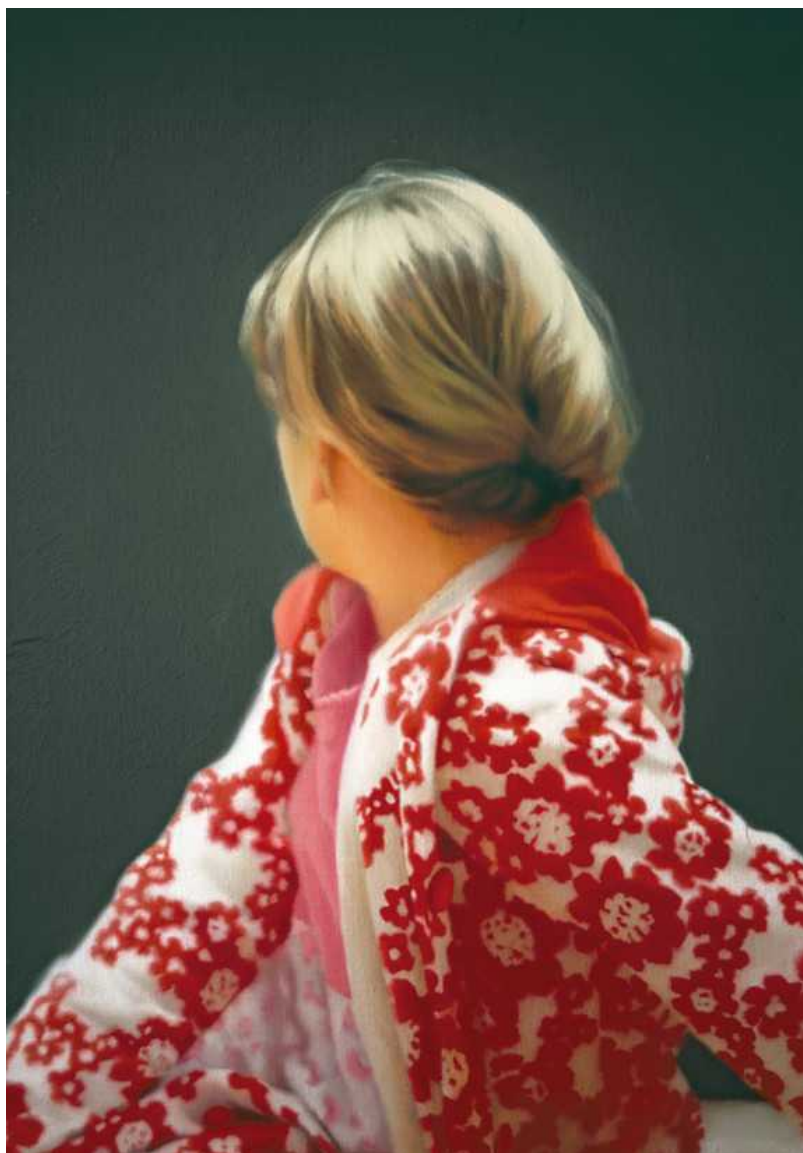
Бетти. Герхард Рихтер. 1988 (© Gerhard Richter)