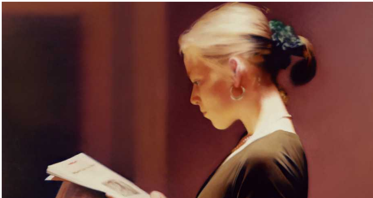
Читательница. Герхард Рихтер.1944 (© Gerhard Richter)

Эти картины заранее готовят посетителя музея к масштабным абстрактным полотнам, одинаково понятным/непонятым зрителям с самым разным культурным багажом. Рихтер не настаивает на определенной интерпретации своих работ, ему в принципе чужды догматизм и выстроенная методология.