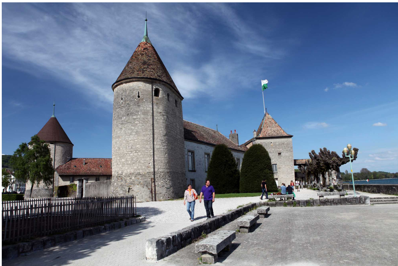
Замок Ролля (А. Shapenko/NashaGazeta.ch)

Auteur: Андрей Шапенко, Роль , 21.03.2014.