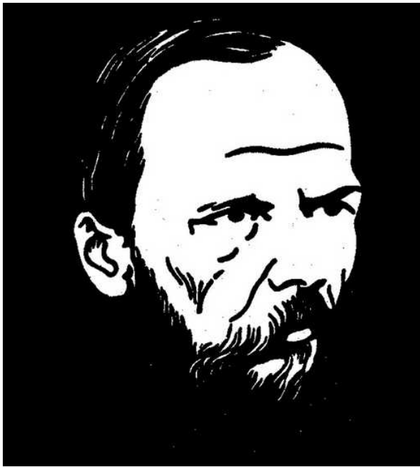
Портрет Достоевского. Феликс Валлотон

заменяли занятия, он умудряется иногда довольно успешно продавать.