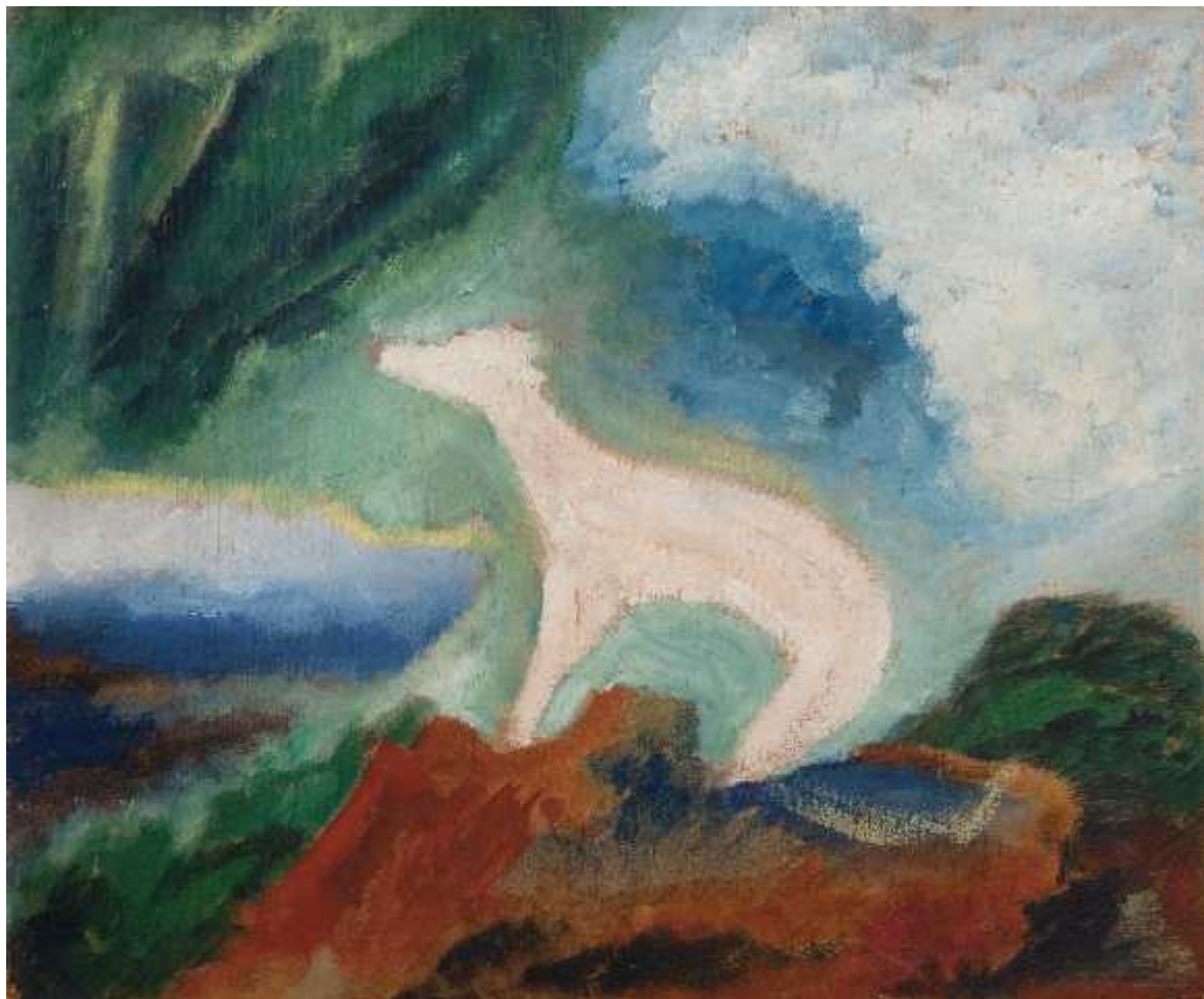
«Корень страха»