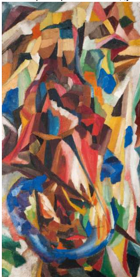
«Абстракция»