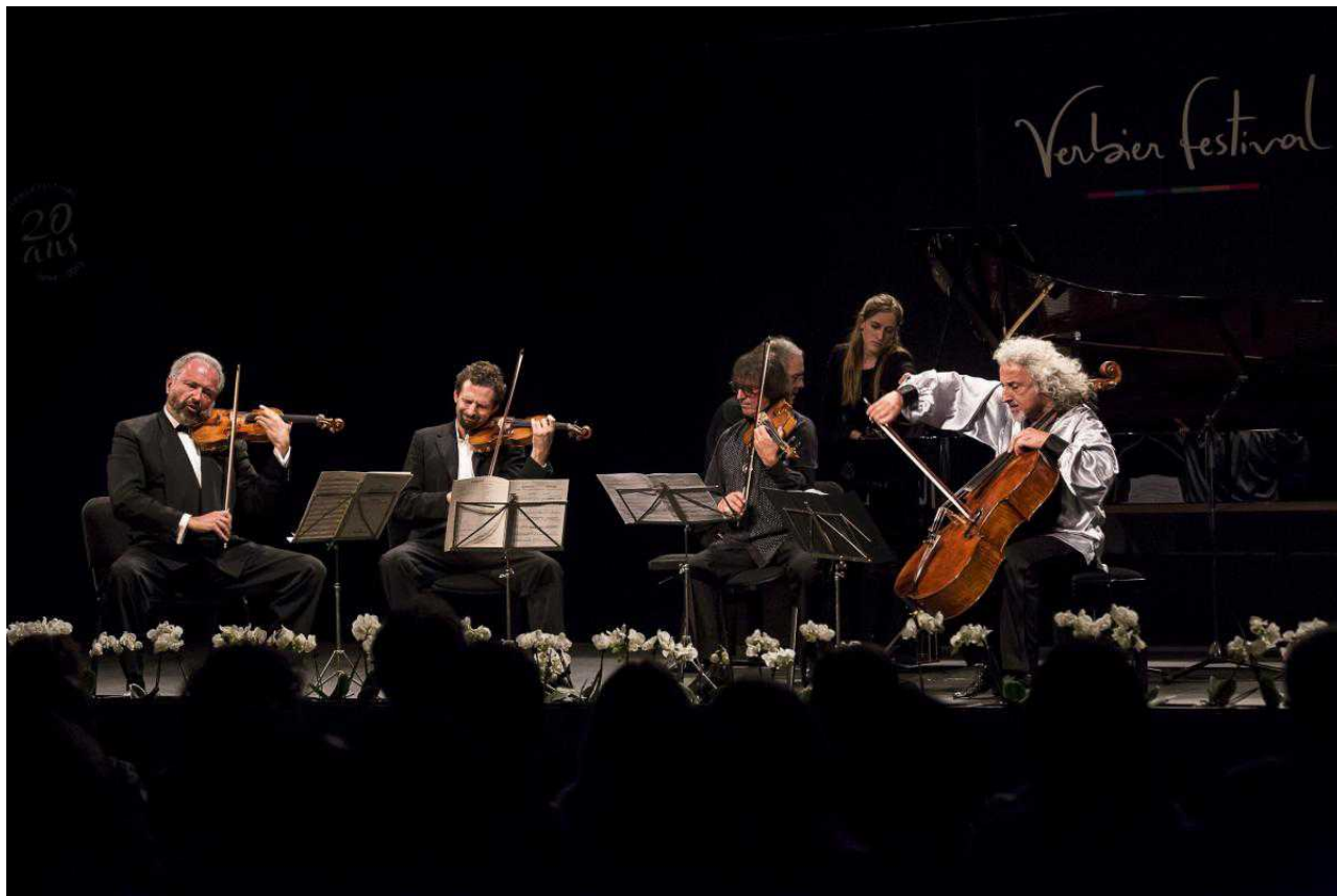
"Русский квинтет" играет Шостаковича (Nicolas Brodard)

Что будет во втором отделении вечера, мы узнали только после антракта – suspense, suspense ! Вот тут-то нас и ждал самый сюрприз, смысл которого нам объяснил его автор, все тот же неутомимый Энгстром.