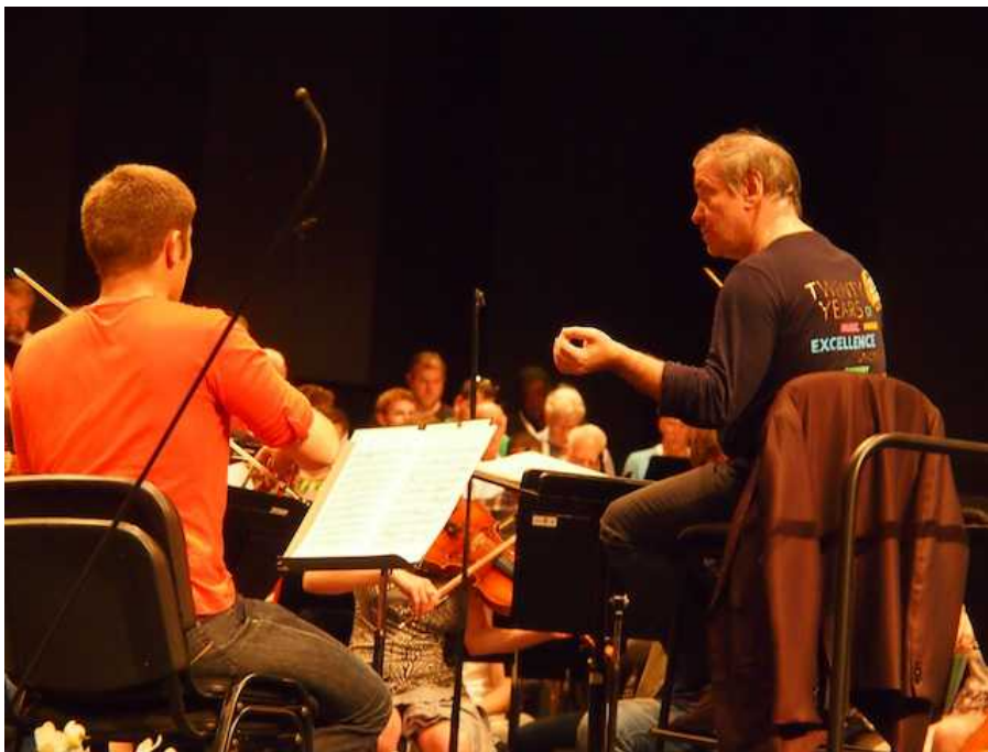
Тише! Гергиев репетирует

Рассказав вчера о запланированном на 25 июля Оперном вечере, мы уже не собирались возвращаться к этой теме. Но побывав вчера на генеральной репетиции «Отелло», которую проводил Валерий Гергиев с Фестивальным оркестром, The Collegiate Chorale, приехавшим сюда из Нью-Йорка, и солистами, а потом и на самом вечере, просто не смогли удержаться.