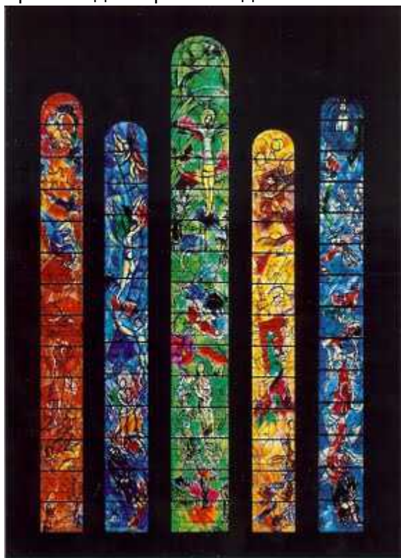
Пять окон Шагала

Центральное, «зеленое» окно посвящено Новому Завету и истории Иисуса Христа. Сверху – распятый и воскресший Иисус. Внизу – Иосиф, дева Мария с младенцем и ягнтя вокруг них. Рядом с Марией, как символ всех земных женщин – ее кузина Елизавета, благословляющая Матерь Божью. Мелкие штрихи, напоминающие кружевную вязь, создают иллюзию Древа жизни. Мария смотрит прямо на зрителя. Пространство между Марией и распятым Иисусом заполнено символами жизни и проповедей Христа. Здесь зеленый цвет с