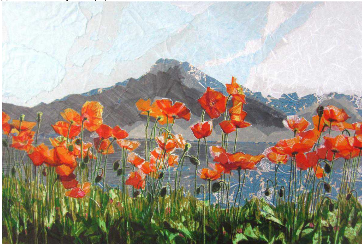
Альпийские маки (© Polina Demidova)

Выставка «Коллажи весны» продлится в галерее Nest по адресу Rue Etienne Dumont, 12 до 17 марта. Галерея открыта с 11 до 19 часов ежедневно. Дополнительную информацию вы найдете на сайте .