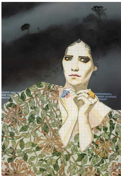
Женский портрет (© Polina Demidova)

Критерий простой – картина должна нравиться, радовать глаз. При этом человек может наслаждаться общим видом, а может всматриваться в детали, открывая для себя все новые смысловые уровни. Коллаж – это метод познания и узнавания мира.