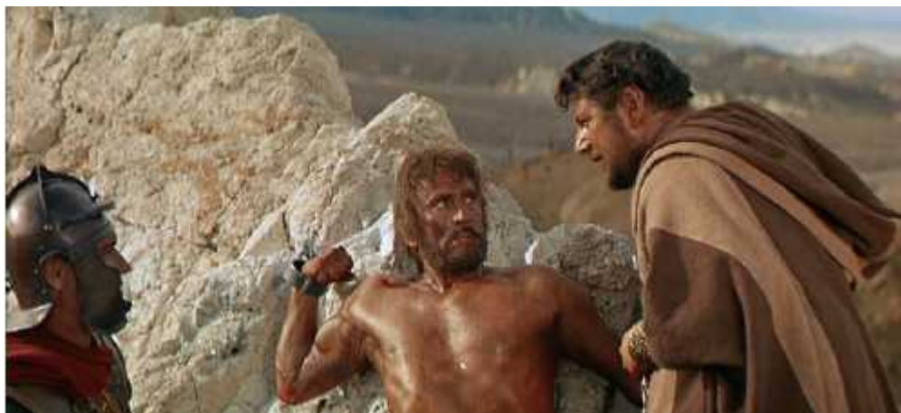
Кирк Дуглас и Питер Устинов в фильме "Спартак" (1960)

Мой отец Питер Устинов учился в престижнейшей школе Англии, Вестминстерском колледже, в компании детей из аристократических семей. Естественно, денег у его родителей не было, но школу оплачивало министерство иностранных дел. В 17 лет он написал свою первую театральную пьесу. Его мать работала декоратором в Ковент-Гардене и показала ее знакомому лондонскому критику. Тот прочел текст, пришел в восторг, пьеса немедленно была поставлена и имела успех. В 18 лет мой отец обрел свое призвание!