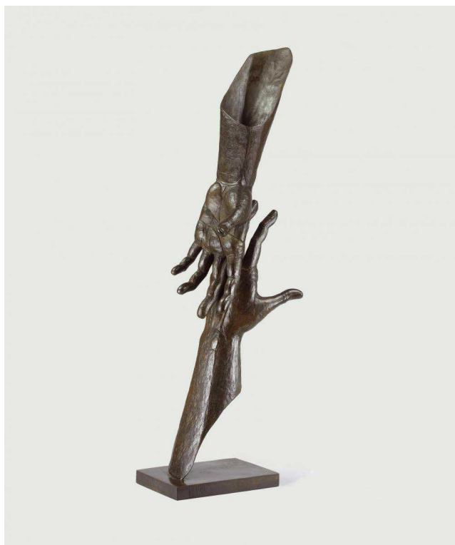
"Confiance"

Все семнадцать детей Бенуа выросли при царском дворе и получили прекрасное образование. Наиболее известен архитектор Николай Леонтьевич Бенуа. Я даже слышал историю, когда отец-кондитер увидел проект работы сына-архитектора в стиле классицизма и воскликнул: «Какое грустное здание, подожди, сейчас я тебе помогу!» Он принес крем и украсил крышу розочками, создав жанр русского барокко. Но я думаю, это неправда.