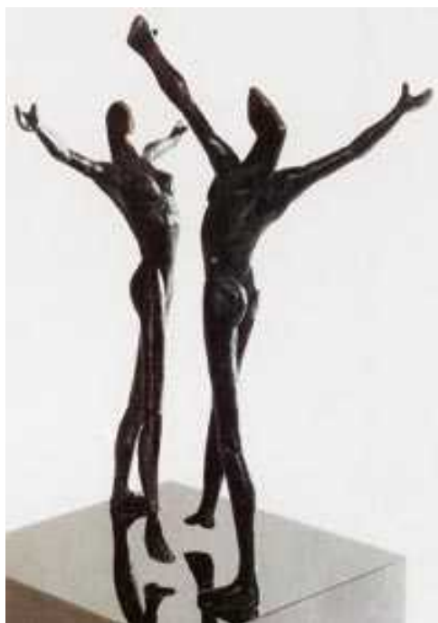
"Танцевальный Оскар" - приз "Benois de la dance" работы Игоря Устинова

Впервые я побывал еще в Советском Союзе в 1975 году, в Ленинграде. Мой отец делал документальную передачу о музее «Эрмитаж» с американской актрисой русского происхождения Натали Вуд. Он взял меня с собой, хотя это было сложно организовать, и за три недели я побывал в залах «Эрмитажа», в запасниках, везде! Я жил с отцом в гостинице «Ленинградская». Для 19-летнего молодого человека, который совершенно не знал своей родины, это был потрясающий опыт. Я почувствовал себя очень близким к русскому народу, потому что увидел, что я не единственный сумасшедший, тут полно других! После отъезда в Швейцарию и изучения французской грамматики и рационализма пожить в России было очень хорошо.