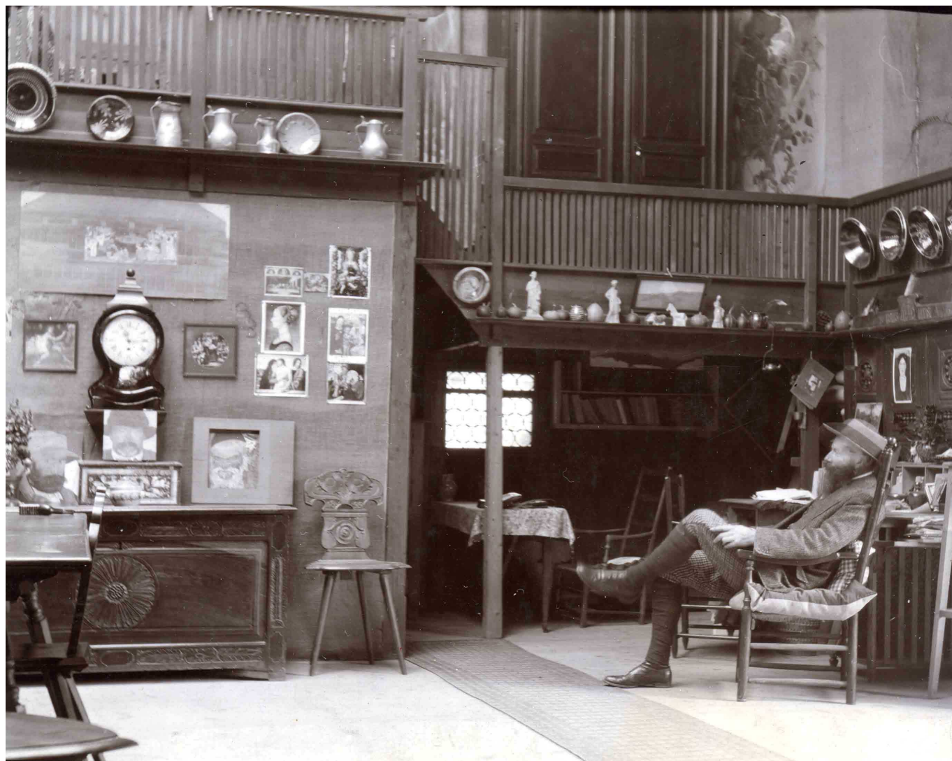
Ernest Biéler dans son atelier de Savièse, vers 1911.