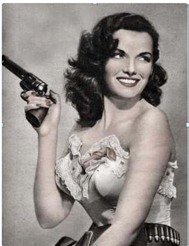
Реклама духов "Бандит"

В 1938 году Дом Высокой моды Робера Пиге переезжает на Rond-Point на Елисейских полях. Теперь ему принадлежит целое здание. Пиге открывает филиал модного Дома в Лондоне, но уже через год он вынужден его закрыть в связи с началом Второй мировой войны. Во время оккупации Дом Пиге продолжает свою работу, но категорически отказывается поставлять свою продукцию в Берлин.