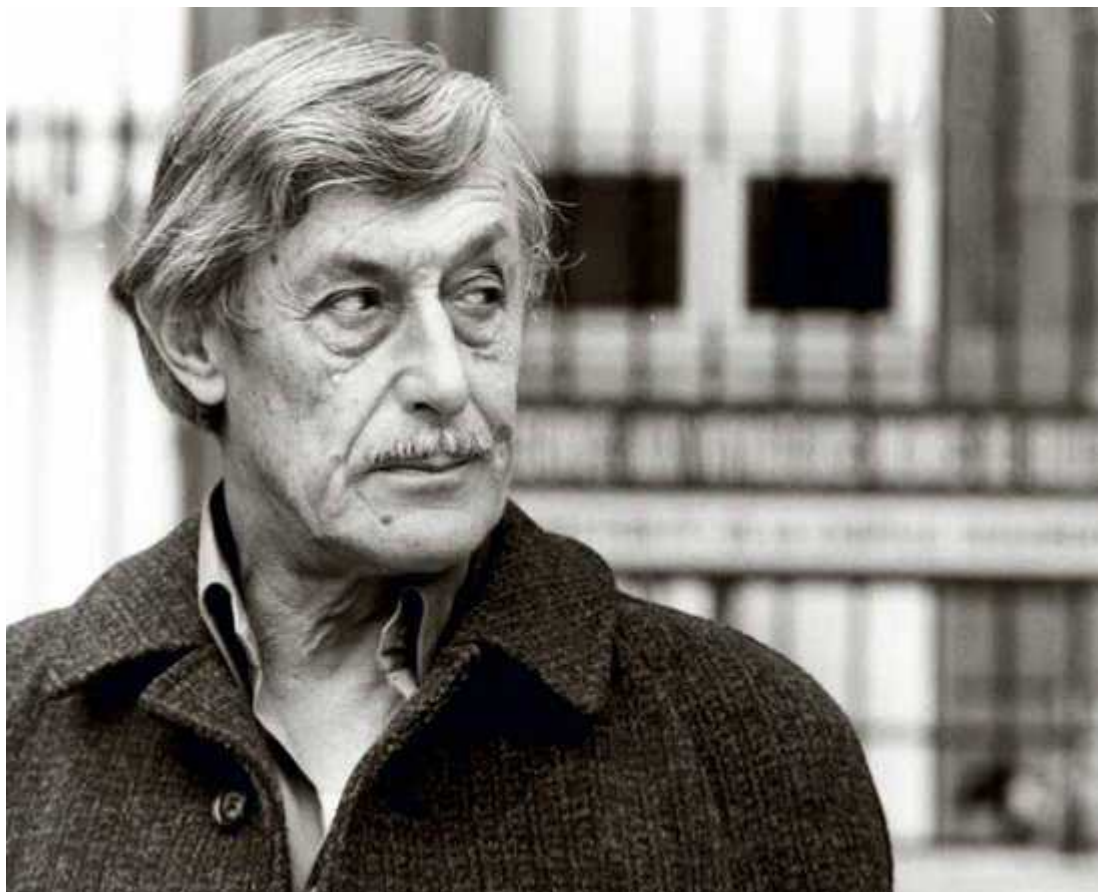
Виктор Платонович Некрасов (1911-1987)

Накануне вечера , который Русский кружок при Женевском университете посвящает 100-летию со дня рождения известного российского писателя, предлагаем вашему вниманию письмо, написанное его коллегой и другом, выдающимся французским славистом Жоржем Нива 25 лет назад – к 75-летию Виктора Некрасова.