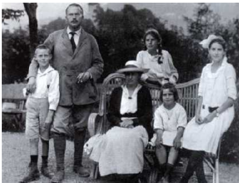
К.Г. Юнг с семьей (1910-е гг.)