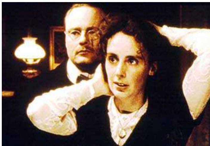
Кадр из фильма: "Меня звали Сабина"

У них есть свой кодекс вежливости, от которого они не отходят. Например, всегда придерживают для нас дверь, когда выходят, а те, кто сидит на краю ряда, встают, чтобы пропустить нас (при этом сами прыгают, как сумасшедшие гимназисты, через столы). Зато никогда не помогут нам надеть пальто; если это кто-то сделает, то точно иностранец. Если к ним обращаешься с вопросом, отвечают очень вежливо, а когда у нас неприятности, то высмеивают. Мы не знали имен наших однокурсников, поэтому давали им различные клички: «Длинноносый», «Болтун» или «Красный Галстук». Позже мы узнали, что и они тоже изобрели для нас всякие прозвища, и не всегда самые приятные. Одну болгарку окрестили «Красавица Галатея», высокую и тощую – «Привидение», а маленькую немецкую студентку-химичку «Хорошенькая Кухарка».