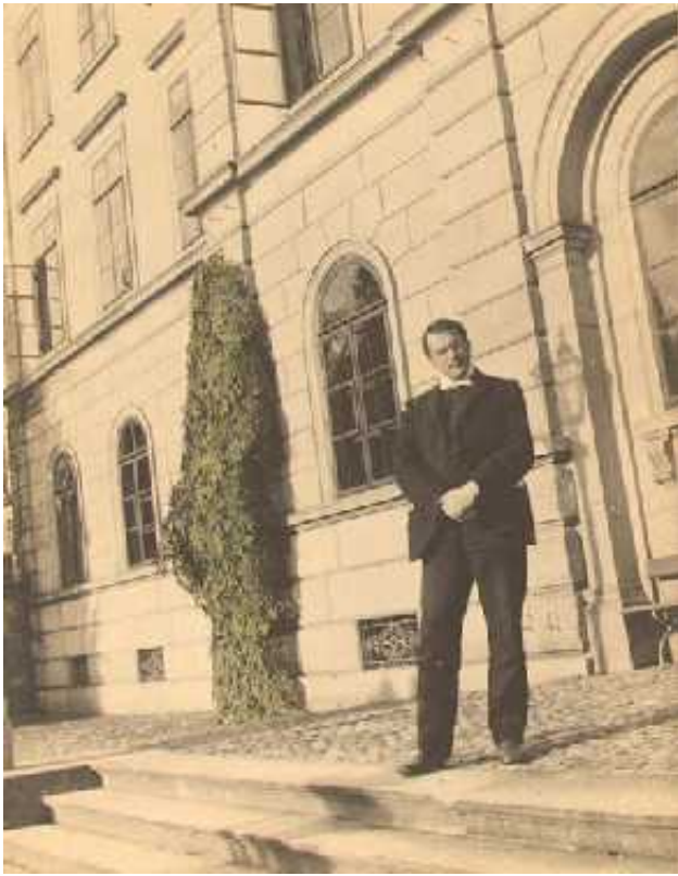
К.Г.Юнг перед главным входом Бургхёльцли, 1910

интеллектуального развития, говорить по-немецки и быть платежеспособным. Шпильрейн прекрасно подходила под эту категорию и стала не просто первой пациенткой будущего медицинского светила, но и чистой доской для начертания психоаналитических теорий, неисчислимым кладезем идей, которые подбрасывала ему ее эмоционально богатая и отзывчивая натура.