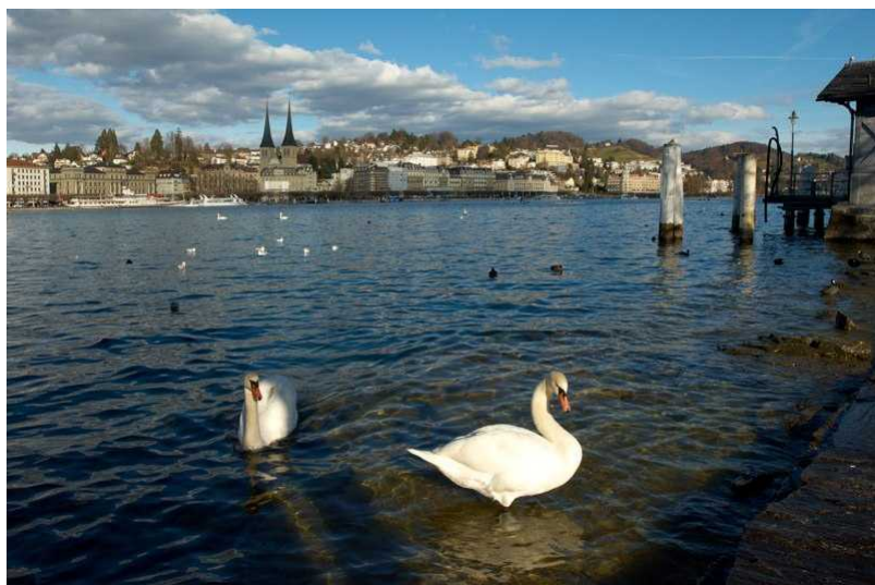
Фирвальдштетское озеро и Старый город Люцерн

Вскоре тропинка привела их к берлоге чудовища. Из пещеры послышался недовольный рев ящера, потревоженного во время послеобеденного отдыха. А вскоре показался и сам дракон, изрыгая пламя и серу. Струтхан перекрестился, ну, пришел последний час! Достоинство встречают смерть швейцарцы, пусть этот чужеземец в том убедится. Но рыцарь чудесным образом преобразился на глазах у