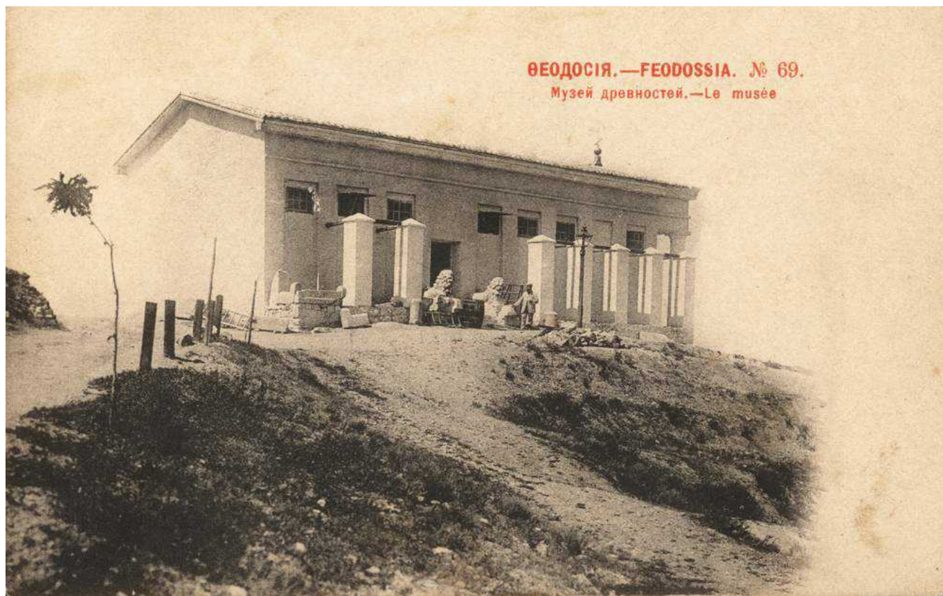
Людвиг Колли перед музеем в Феодосии

Auteur: Лейла Бабаева, Феодосия , 20.04.2011.