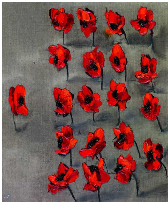
Лаврентий Бруни "Маленький принц"

проследить за игрой пигментов и структурой краски на «фрагменте» из 30 см), так и на расстояния, охватывая взглядом весь холст. Таким образом мы открываем, что художник передал движение волны одновременно оттенком и размером цветков: в средней, более глубокой части, цветки поменьше и более темные, чтобы подчеркнуть одновременно тень и удаленность глубины. При этом нижняя и, особенно, верхняя части как бы приближаются к зрителю благодаря свечению цветков, одновременно более светлых и более крупных. Перевернутые стебли усиливают эффект динамики настолько, что кажется, что волна вот-вот перевернет зрителя.