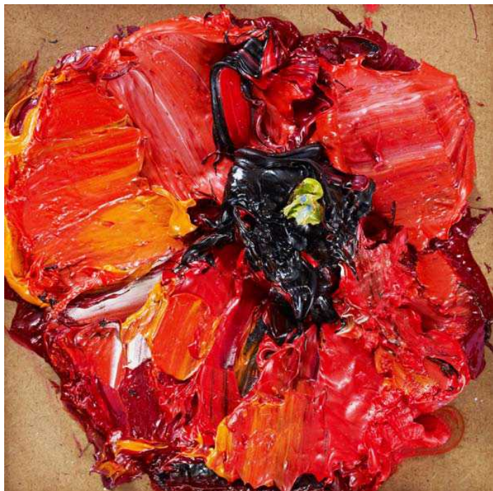
Лаврентий Бруни "Поцелуй"

В экспозиции под названием «Цветы» галерея Artvera's представляет около сорока работ Лаврентия Бруни, объединенных поэтикой цветка: масляные картины небольших и монументальных форматов, огромные акварели на специальной бумаге Arches, а также видео инсталляция. Вот уже скоро тридцать лет этот талантливый русский художник страстно посвящает свое мастерство цветам. Хорошо известный в своей стране, он получил признание также в странах Европы, в США и Японии.