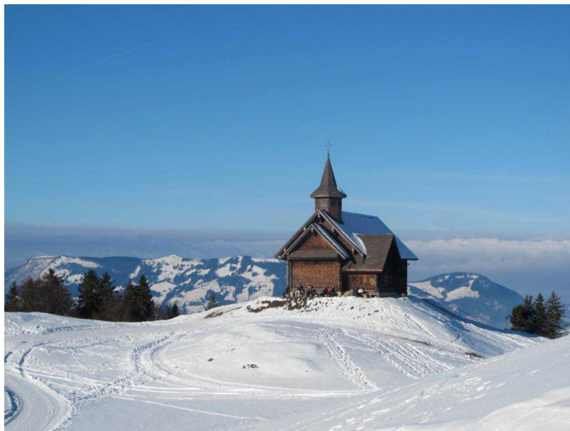
Католическая часовня Штооса

8 отелей, 9 пансионатов, общежития для школьников и так называемые гостевые квартиры. В этих квартирах с прекрасными видами на Альпы можно жить и самим готовить пищу. К услугам ленивых и неэкономных 9 ресторанов с местной и интернациональной кухнями. С совсем не крутыми по меркам швейцарских курортов ценами.