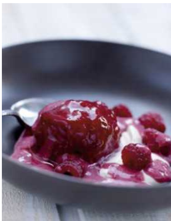
Малиновый сорбет

Напоследок предлагаем попробовать несколько освежающих и легких летних рецептов.