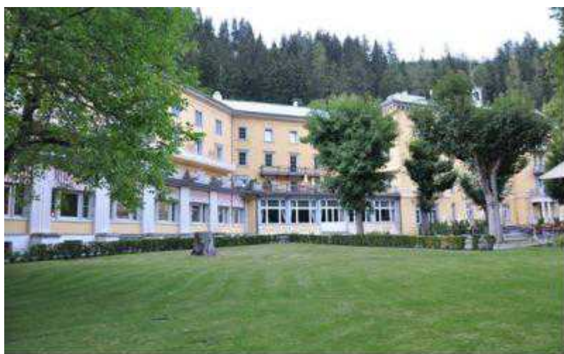
Scuol Hôtel Palace

Author: Надежда Сикорская, Женева , 29.03.2010.