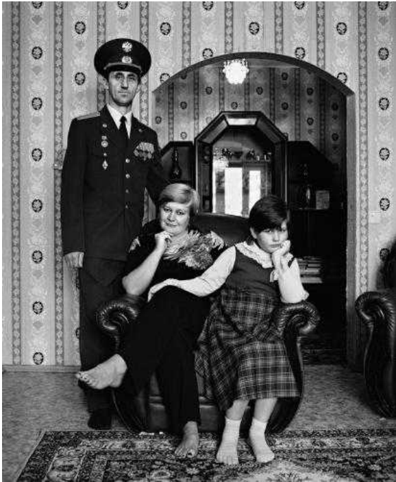
Семья офицера бронетанковых войск

любыми способами заполучить портреты тех, кого любил.