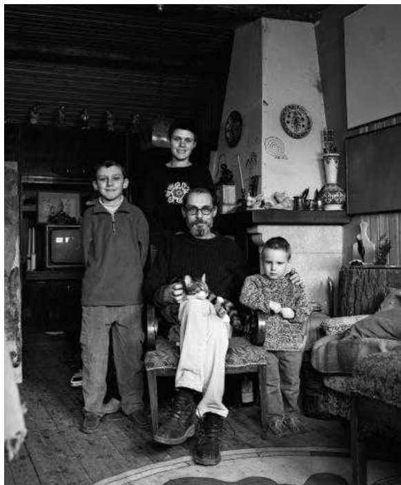
Семья хирурга.

Владимира Мишукова занимала идея семьи в современном, точнее, постсоветском обществе: его модели - жители Москвы и Подмосковья, а снимки были сделаны в 2003-2006 годах. Мысль фотографа - отразить социальные изменения в переходный период, используя в качестве зеркала общества семейные портреты его представителей. В итоге, речь шла о двусмысленной интимности, и возникал практически новый жанр: интимный портрет с социальным аспектом. Последний, к тому же, ярко выраженный, на что указывает подписи к фотографиям: семья крестьянина, семья дальнотойщика, охранника в театре, хирурга, менеджера, инженера... В их собственных квартирах, в одежде, которую они сами выбирали, в позах, которые сами находили. Впрочем, последнее заслуживает оговорок: Мишуков признался, что все-таки частично выступал постановщиком в запечатленных семейных сценах, но невооруженным взглядом расстановку действующих лиц фотографом тоже можно заметить.