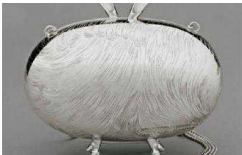
Сумочка из серебра Egg Bag

Author: Надя Мишустина, Цюрих , 29.07.2009.