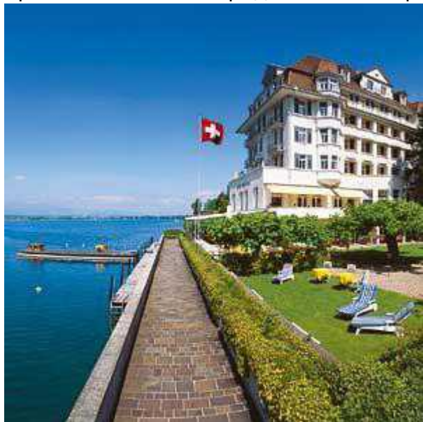
Отель Bellevue в Туне "Утихла биза, легче дышит Лазурный брег женеvских вод"

Через несколько месяцев за самовольную отлучку Тютчев был лишен звания камергера и уволен со службы. Только в 1844 году после возвращения в Петербург ему возвращают должность и звание. В 1857 году Тютчева избирают членом-корреспондентом Академии наук, а в следующем году назначают председателем Комитета иностранной цензуры; на этой должности он много сделает для защиты свободы слова в России. Успешная профессиональная карьера Тютчева сопровождается широким признанием его поэтического дара, высоко оцененного современниками. В 1850 году жизнь Тютчева озаряет новая любовь - к воспитаннице Смольного института Елене Денисьевой, которая была намного моложе поэта и пожертвовала для него всем, в том числе своей репутацией в свете, поскольку Тютчев не считал себя вправе расторгнуть законный брак. Любовный треугольник, принесший много страданий всем, просуществовал четырнадцать лет.