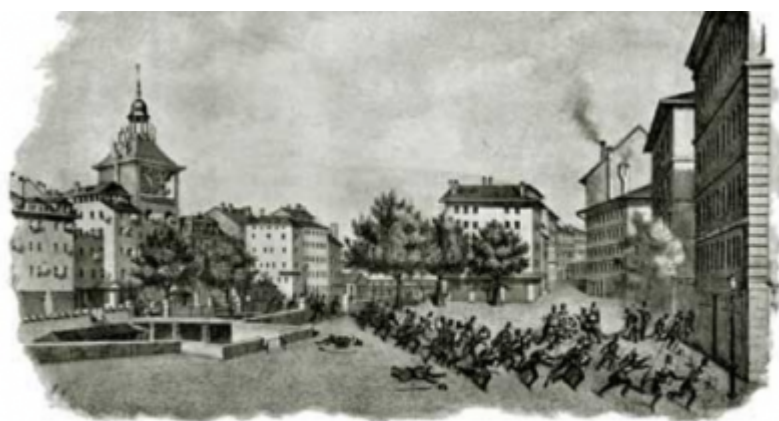
La Révolution à Genève en 1846 La retraite des troupes du gouvernement Dessin de Jean Chomel

Author: Людмила Клот, Женева , 13.10.2008.