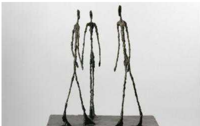
Альберто Джакометти, "Трое идущих I"