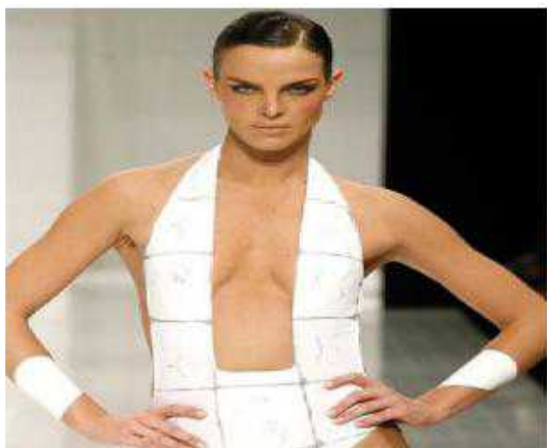
Купальник Lenny весна-лето 2008

Author: Надя Мишустина, Женева , 04.07.2008.