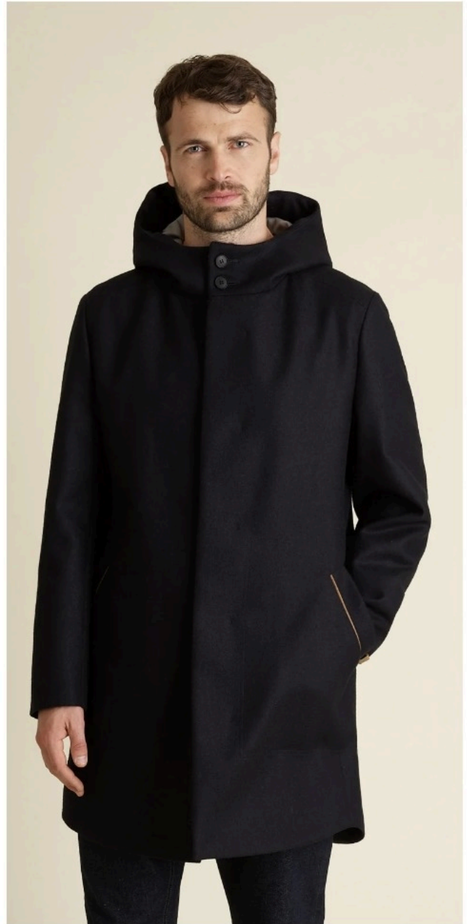
Пальто Lana от Muntagnard.

Что касается устоявшихся брендов, то в этой категории награда досталась семейной текстильной компании Sântis Textiles из Аппенцелля-Ауссерродена. Основанное двадцать лет назад предприятие специализируется на разработке волокон, нитей и тканей для мирового рынка. В Sântis Textiles используют собственную технологию RCO100, с помощью которой хлопковые отходы могут быть преобразованы в новые волокна без использования воды и химикатов. Сначала текстильные отходы производственного процесса (обрезки ткани и отходы пряжи), а также одежда (новая и бывшая в употреблении) сортируются по цвету и составу и разделяются до состояния волокон. Потом происходит очистка, в процессе которой волокна сохраняются в их естественном состоянии. Механически переработанный таким образом хлопок похож на новый и готов к прядению в 100% переработанную хлопковую пряжу. Отличный пример того, как инженерные разработки помогают сделать моду более устойчивой! Компания считается одним из технологических лидеров Швейцарии в области текстильной циркулярной экономики.