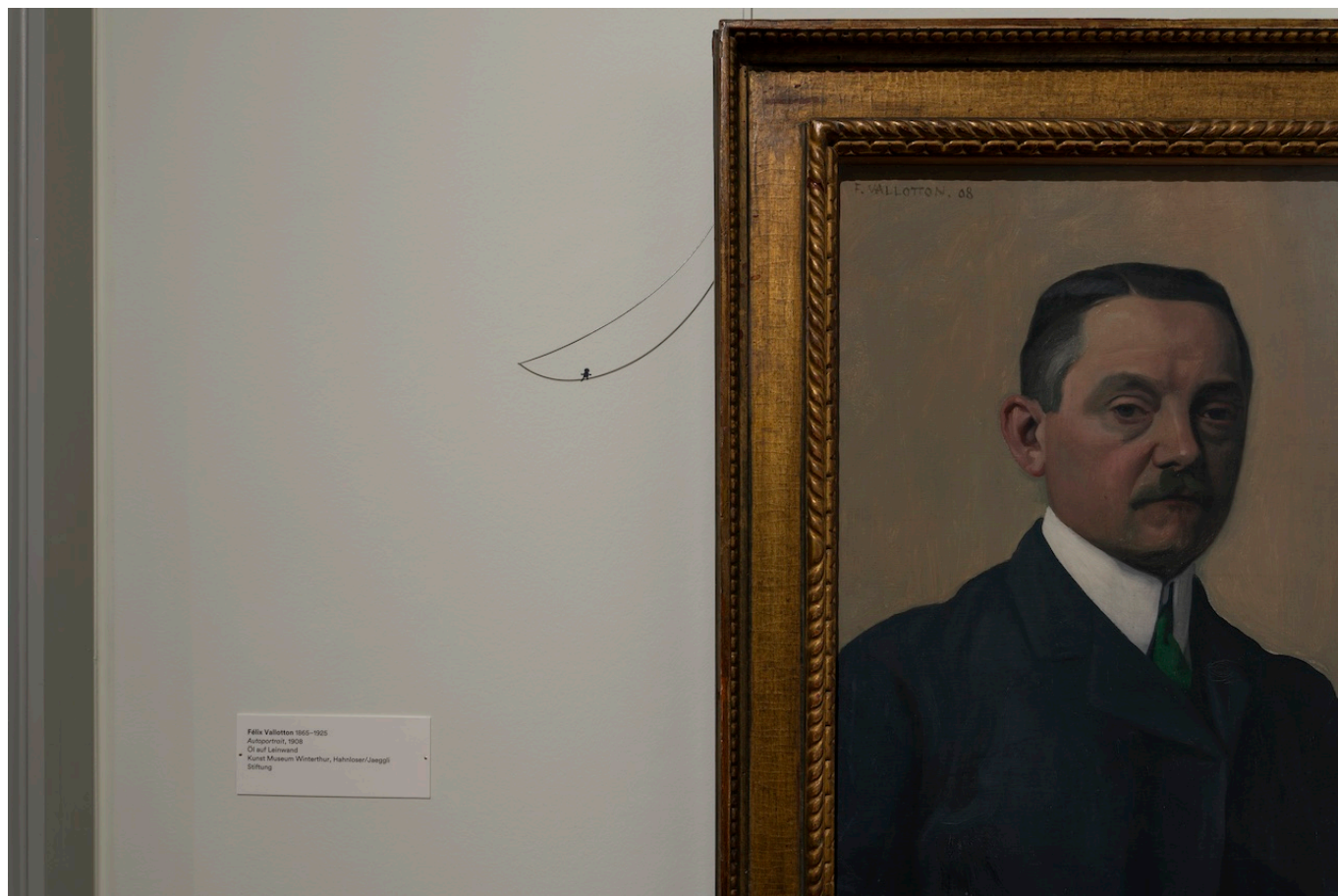
Недко Солаков. Быть Валлоттоном, 2025 г.

В итоге выставка Солакова, столь умно вписанная в «валлатоновские» залы виллы «Флора», славит швейцарского художника не меньше (а, возможно, и больше) иных «мемориальных» экспозиций. В интерпретации Солакова Валлотон оказывается не просто одним из «набистов», модным художником, писавшим востребованные портреты и выразительные пейзажи, но первооткрывателем, искавшим оптимальную форму для выражения своих художественных идей. Возможно, эта трактовка и субъективна, но зато насколько теплее все побывавшие на выставке будут теперь относиться к отметившему в этом году свое 160-летие Валлотону, и насколько более живым он будет им казаться. Не это ли главная цель любой «датской» выставки, даже такой необычной, как «Быть Валлоттоном» Недко Солакова в Винтертуре?