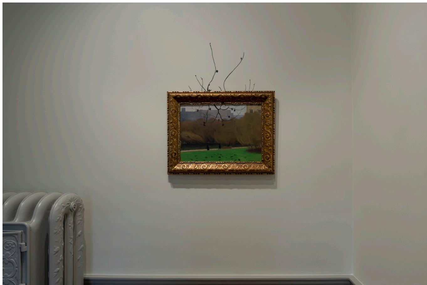
Недко Солаков. Быть Валлоттоном, 2025 г.

коллекции немало самых разных работ знаменитого швейцарца, куратор Конрад Биттерли пригласил к осмыслению его творчества живущего в Софии художника-концептуалиста. Солаков – не только самый известный современный болгарский художник в мире, участник Венецианской биеннале и Кассельской documenta , но и автор замечательно остроумных художественных историй, «читать» которые – отдельное удовольствие.