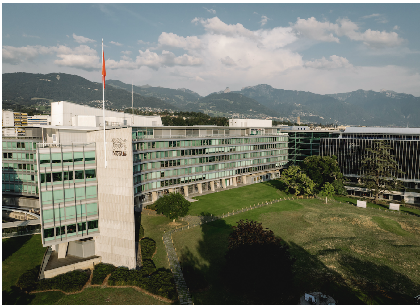
Штаб-квартира Nestlé в Вебе

Author: Заррина Салимова, Вебе , 21.10.2025.