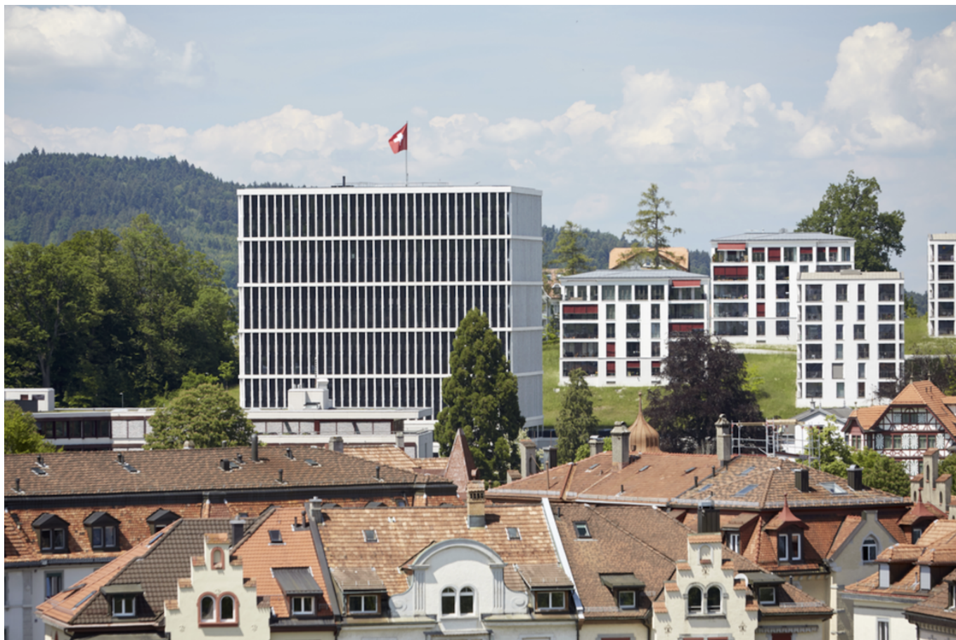
Здание федерального административного суда в Санкт-Галлене © TAF

Author: Заррина Салимова, Санкт-Галлен , 16.10.2025.