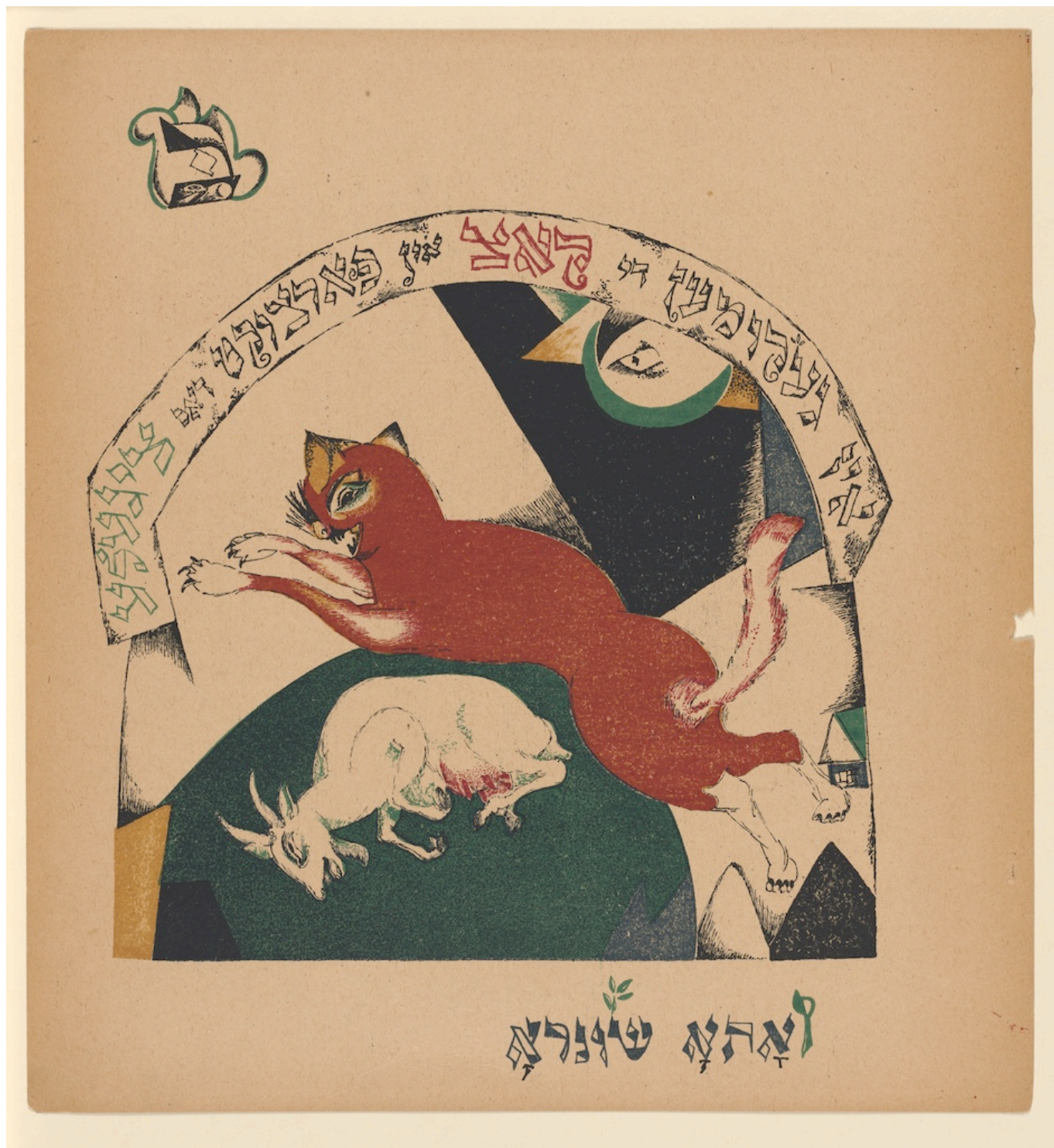
Эль Лисицкий. "Вот пришла кошка", 1919. Из серии « Chad Gadjä », © Kulturstiftung Sachsen-Anhalt, Kunstmuseum Moritzburg Halle (Saale)

Кто не верит на слово, может поехать в Беллинцону и убедиться: выставка «Looking for Lissitzky. Эль Лисицкий и Швейцария (1919-1929)», идущая сейчас в Museo Villa dei Cedri и организованная при участии Фонда графического искусства Цюриха (Graphische Sammlung ETH Zürich) приглашает открыть для себя художественную вселенную Лисицкого во всех её измерениях: от графического искусства до архитектуры, от издательского дела до типографики, до теории и критики искусства и архитектуры. Она раскрывает образ «тотального» художника, способного преодолевать дисциплинарные и культурные границы.