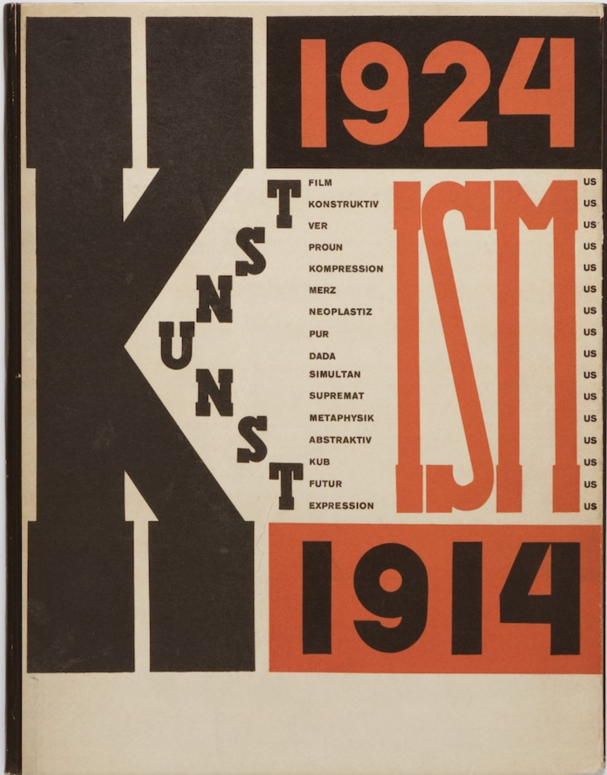
Эль Лисицкий и Ханс Арп. Die Kunstisten. 1914-1924, 1925 г. Museum für Gestaltung Zürich, Grafiksammlung, ZHdK