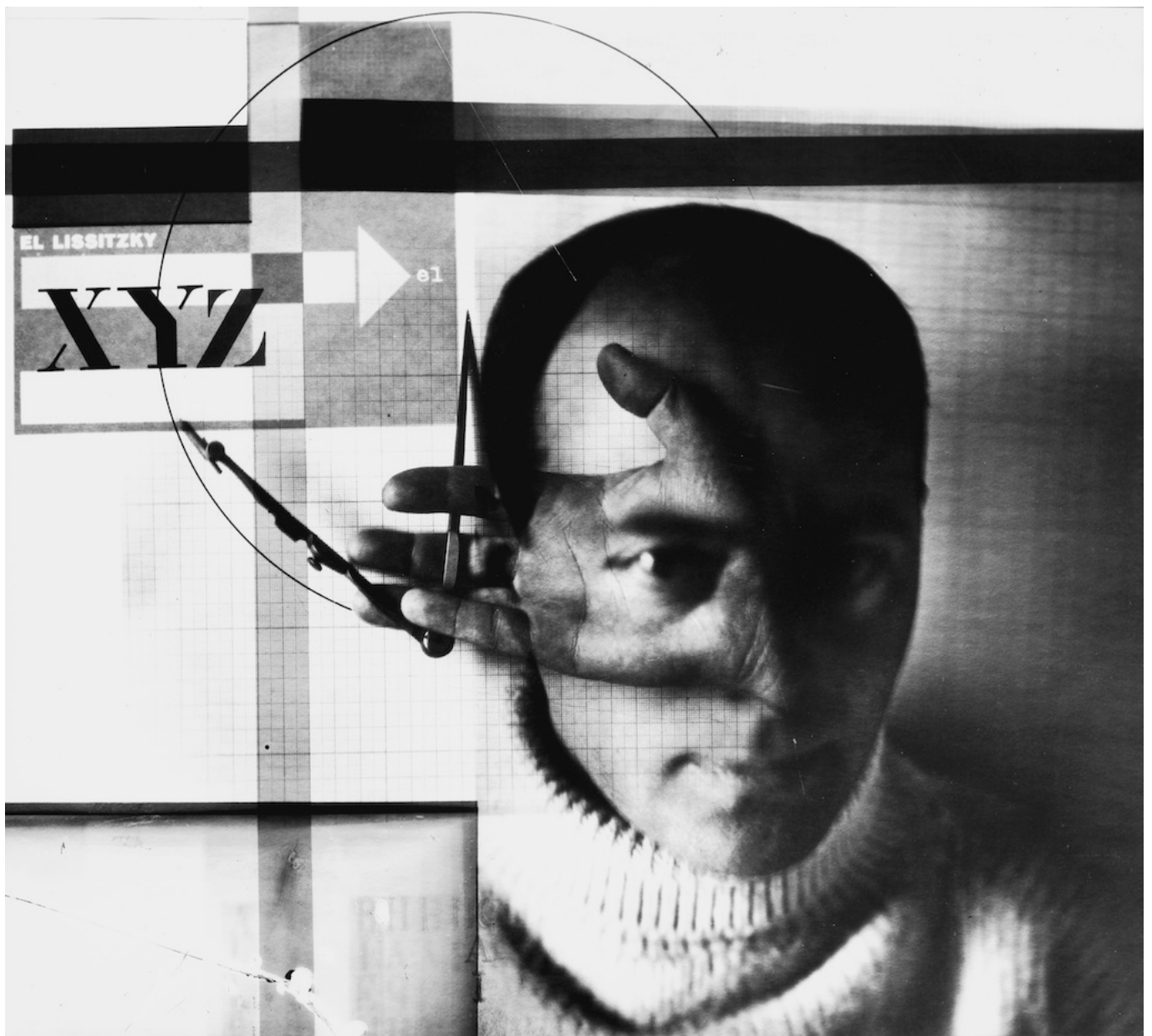
Эль Лисицкий. Автопортрет ("Стороитель"), 1924 г.

Author: Надежда Сикорская, Беллинцона , 14.10.2025.