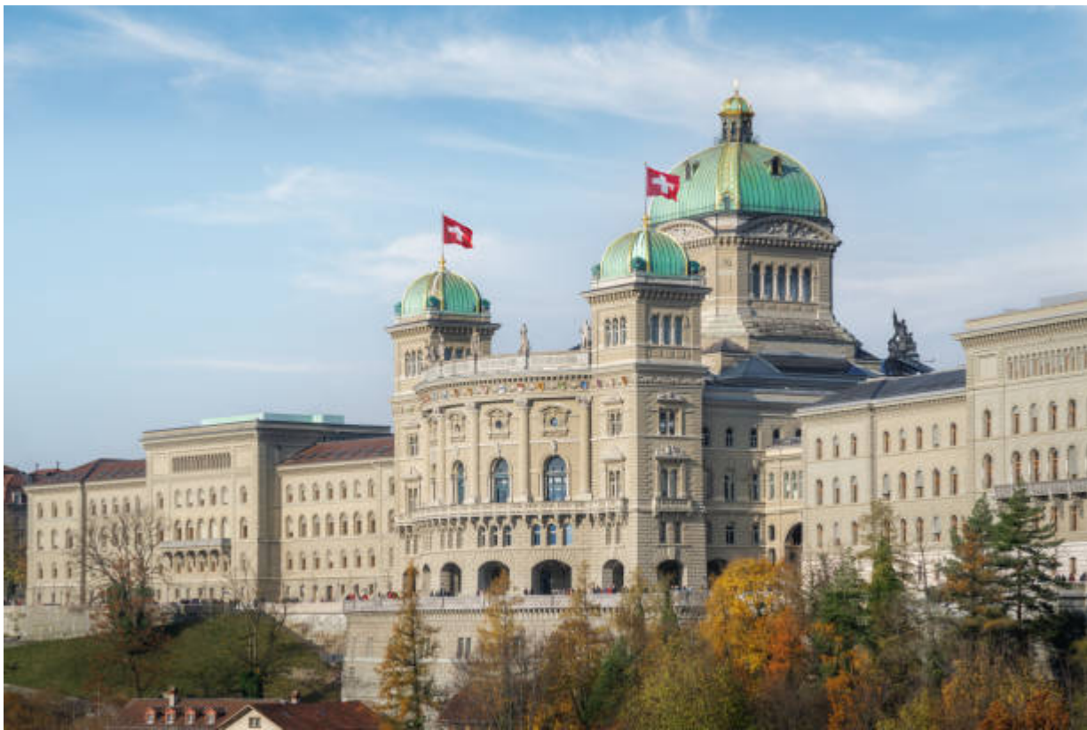
Федеральная дворец в Берне

Author: Надежда Сикорская, Берн , 06.10.2025.