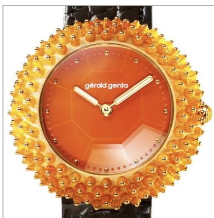
GÉRALD GENTA Gentissima Oursin Fire Opal