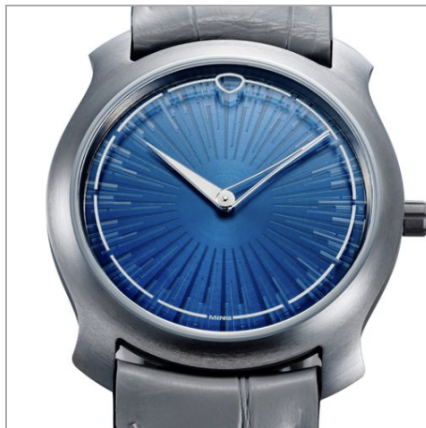
MING Project 21