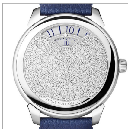
LOUIS VUITTON Tambour Convergence platine