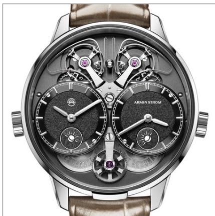
ARMIN STROM Dual Time GMT Resonance Manufacture Edition