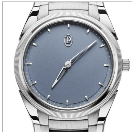
PARMIGIANI FLEURIER Tonda PF Micro-Rotor Platinum