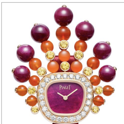
PIAGET Swinging Sautoir