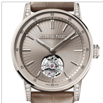
AUDEMARS PIGUET Code 11.59 by Audemars Piguet Tourbillon Volant Automatique