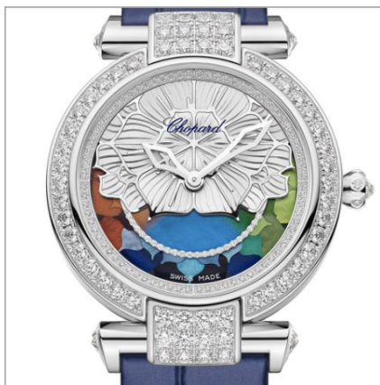
CHOPARD Imperiale Four Seasons