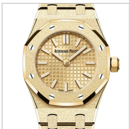
AUDEMARS PIGUET Royal Oak Mini Frosted Gold Quartz

Для каждой из пятнадцати категорий предусмотрены особые критерии. В частности, в категорию «Женские часы» включены модели, оснащенные индикаторами часов, минут, секунд, даты (день месяца), запаса хода, классических фаз Луны и украшенные драгоценными камнями весом не более 9 карат.