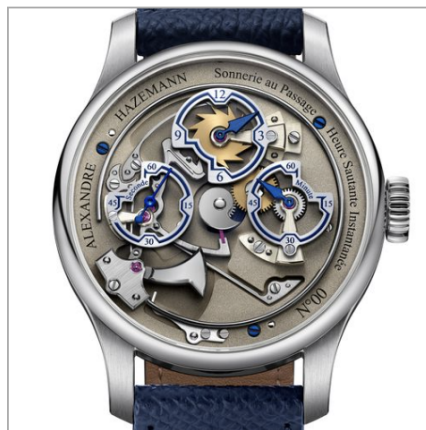
HAZEMANN & MONNIN Montre École Souscription