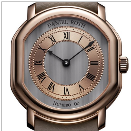
DANIEL ROTH Extra Plat Or Rose