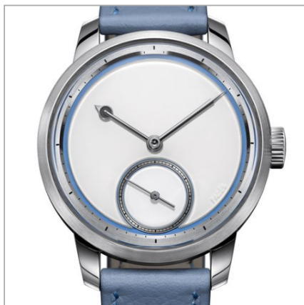
RAÚL PAGÈS RP2