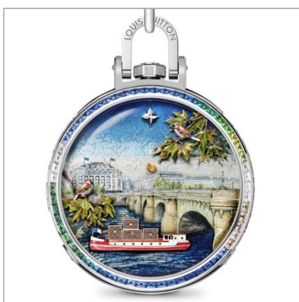
LOUIS VUITTON Escale au Pont-Neuf