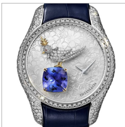
TIFFANY & CO. Bird on a Rock Legacy Tanzanite