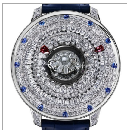
JACOB & CO The Mystery Tourbillon 44mm

Часы-финалисты в категории «Женские часы с осложнениями».