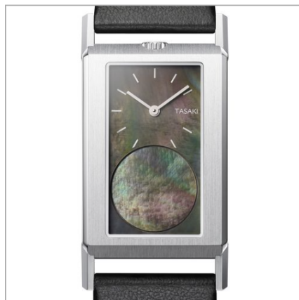
TASAKI Face of TASAKI (Nacre noir)

Часы-финалисты в категории «Только время».