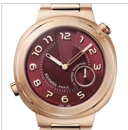
HERMÈS Hermès Cut Le temps suspendu