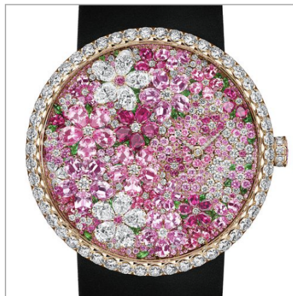
DIOR MONTRES La D de Dior Buisson Couture