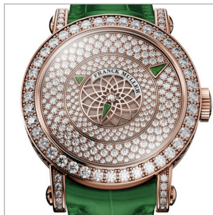
FRANCK MULLER Round Triple Mystery