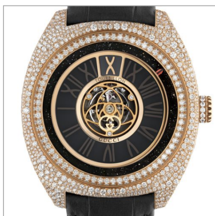
GUCCI Gucci Interlocking