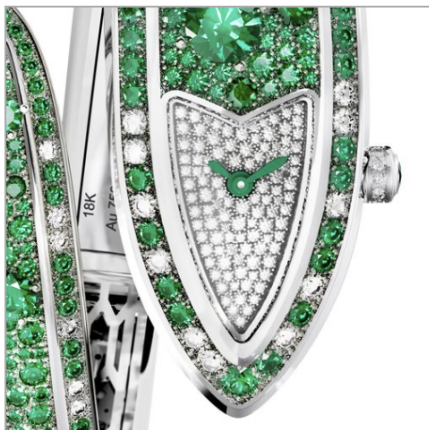
BVLGARI Serpenti Aeterna