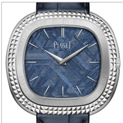
PIAGET Andy Warhol Watch Clou de Paris Edition