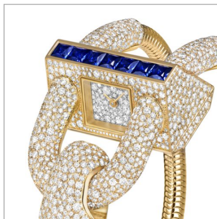
VAN CLEEF & ARPELS Cadenas

Часы-финалисты в категории «Ювелирные часы».