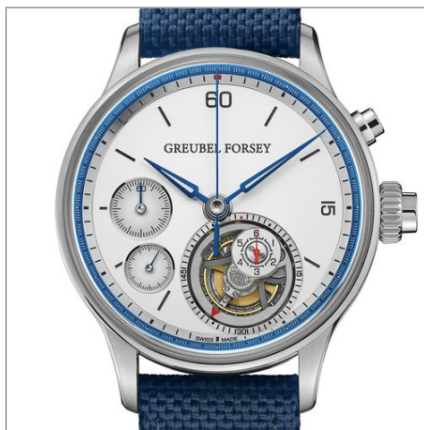
GREUBEL FORSEY Nano Foudroyante