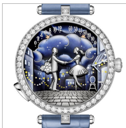
VAN CLEEF & ARPELS Lady Arpels Bal des Amoureux Automate

Часы-финалисты в категории «Механическое исключение».