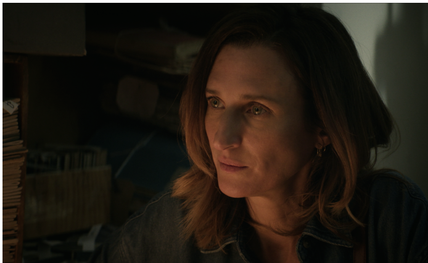
Кадр из фильма «В стране Арто»