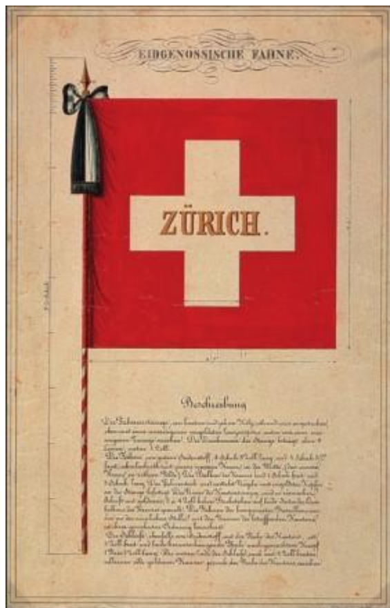
Рисунок пером первого федерального флага, выполненный в 1841 году Карлом Штауффером. Проект Штауффера с подробными пояснениями и размерами был отправлен в кантоны для использования в качестве образца для будущих флагов пехотных батальонов.

С этого момента прогрессивные и националистические слои населения (в частности, гимнастические клубы, стрелковые общества и хоры) начали использовать этот символ. Первый единый военный флаг был принят только в 1840 году по инициативе будущего генерала Гийома-Анри Дюфура, восседающего сегодня на коне на площади перед Оперным театром Женевы. Каждый кантональный пехотный контингент был представлен крестом на красном фоне, состоящим из пяти равных белых квадратов, на которых золотыми буквами было написано название кантона. Федеральная конституция 1848 года, которая закрепила рождение Швейцарии в том виде, в каком мы ее знаем сегодня, обязала все войска использовать этот флаг.