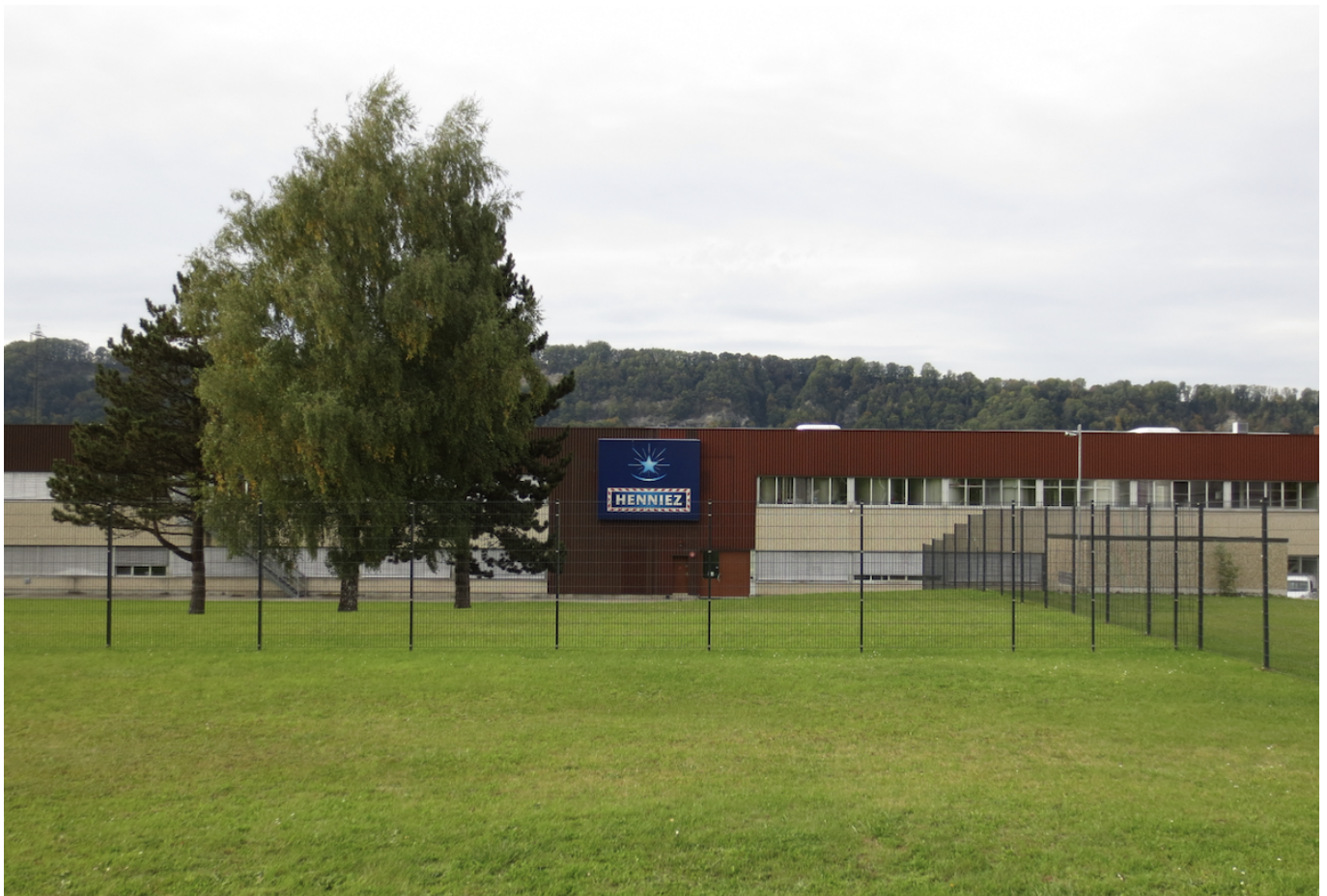
Завод Henniez в Энне.

Author: Заррина Салимова, Лозанна , 03.07.2025.