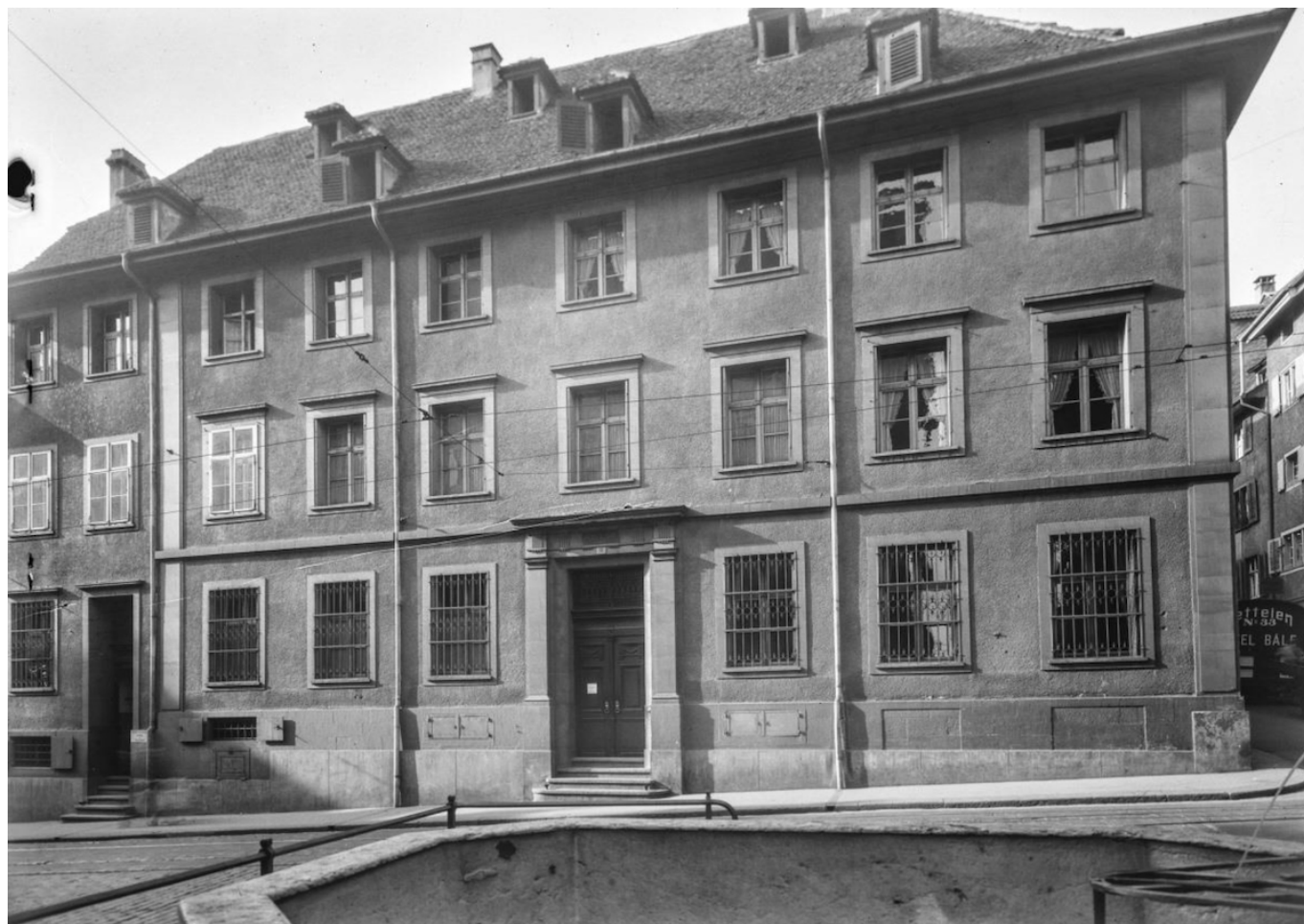
Так выглядел Сегерхоф