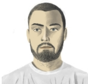
Леонид Слонимский Leonid Slonimsky