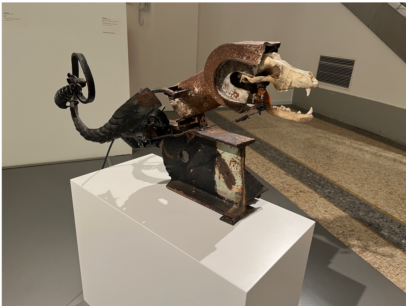
Жан Тэнгли (1925-2025). Собачка Ники, 1981 г.

Среди других работ, на которые точно стоит обратить внимание, – Méta-Herbin, Relief Bleu, FIAC, the Gay Machine... Каждый из скульптурных механизмов готов к включению и движению, сопровождаемому самыми разными звуками. Правда, самим посетителям нажимать на педали не разрешается, но все снабженные моторчиками экспонаты оживают на некоторое время каждые 15-20 минут, так что нужно лишь набраться терпения. Некоторые работы больше других располагают к тому, чтобы перед ними застыть, например «Фонтан смерти» (Fontaine de la mort, 1989). Думаем, юные посетители оценят «Собачку Ники» с черепом вместо морды, созданную в 1981 году в память о почившем любимце Ники де Сен-Фаль - выставка продлится до 7 сентября, так что время еще есть.