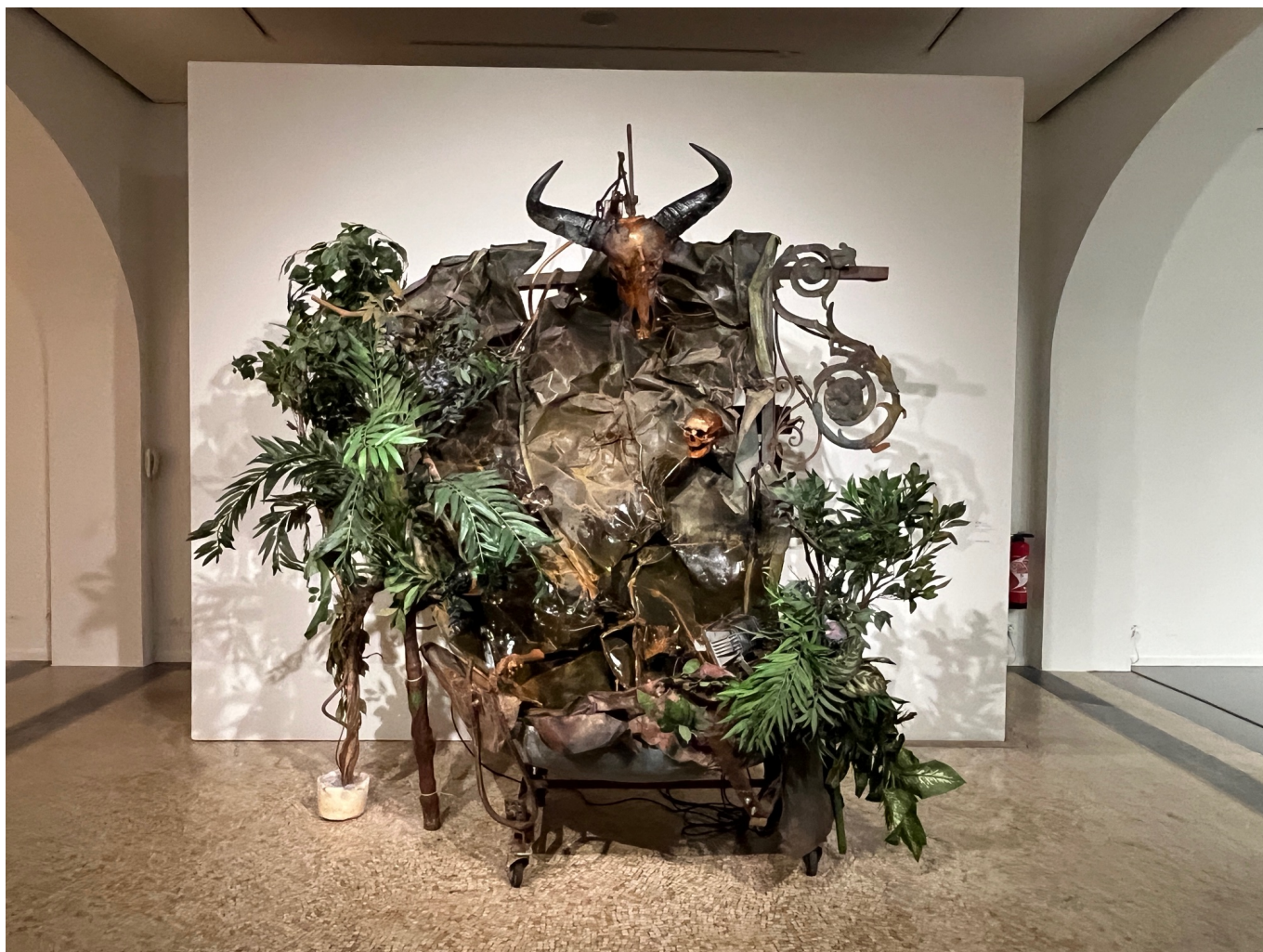
Жан Тэнгли (1925-2025). Фонтан смерти, 1989 г.

Вообще же, чтобы возродить дух последней женеvской выставки Тэнгли, прошедшей в 1983 году в Музее Рата, одном из подразделений МАН, со вчерашнего дня, то есть точно с даты рождения скульптора, 22 мая, в том же здании музей представляет более тридцати механических скульптур и сорок с лишним работ на бумаге, некоторые из которых демонстрируются впервые и имеют историческую связь с Женевой и ее регионом. Отметим, не так давно музей получил значительное пожертвование графических работ Тэнгли от Niki Charitable Art Foundation, частного фонда, занимающегося наследием его жены, знаменитой французской художницы Ники де Сен-Фалль – по окончании выставки около двадцати работ останутся в женеvской коллекции.