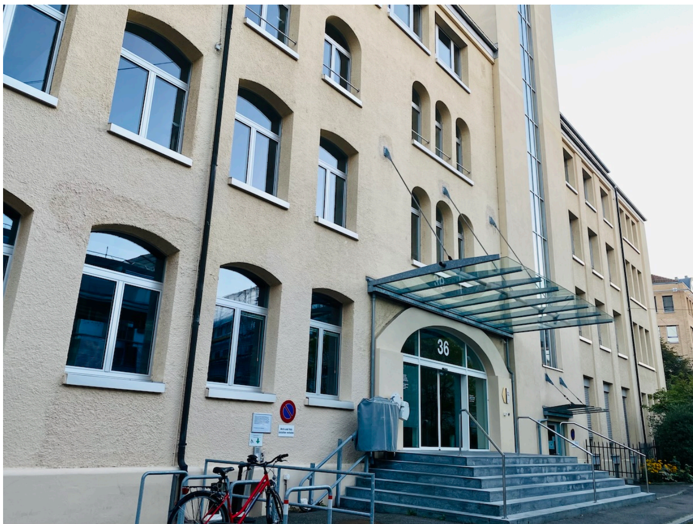
Офис Сесо в Берне.

Author: Заррина Салимова, Берн , 02.04.2025.