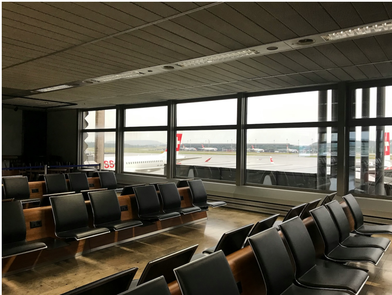
Зал ожидания в Цюрихском аэропорту.

Author: Заррина Салимова, Цюрих , 10.03.2025.