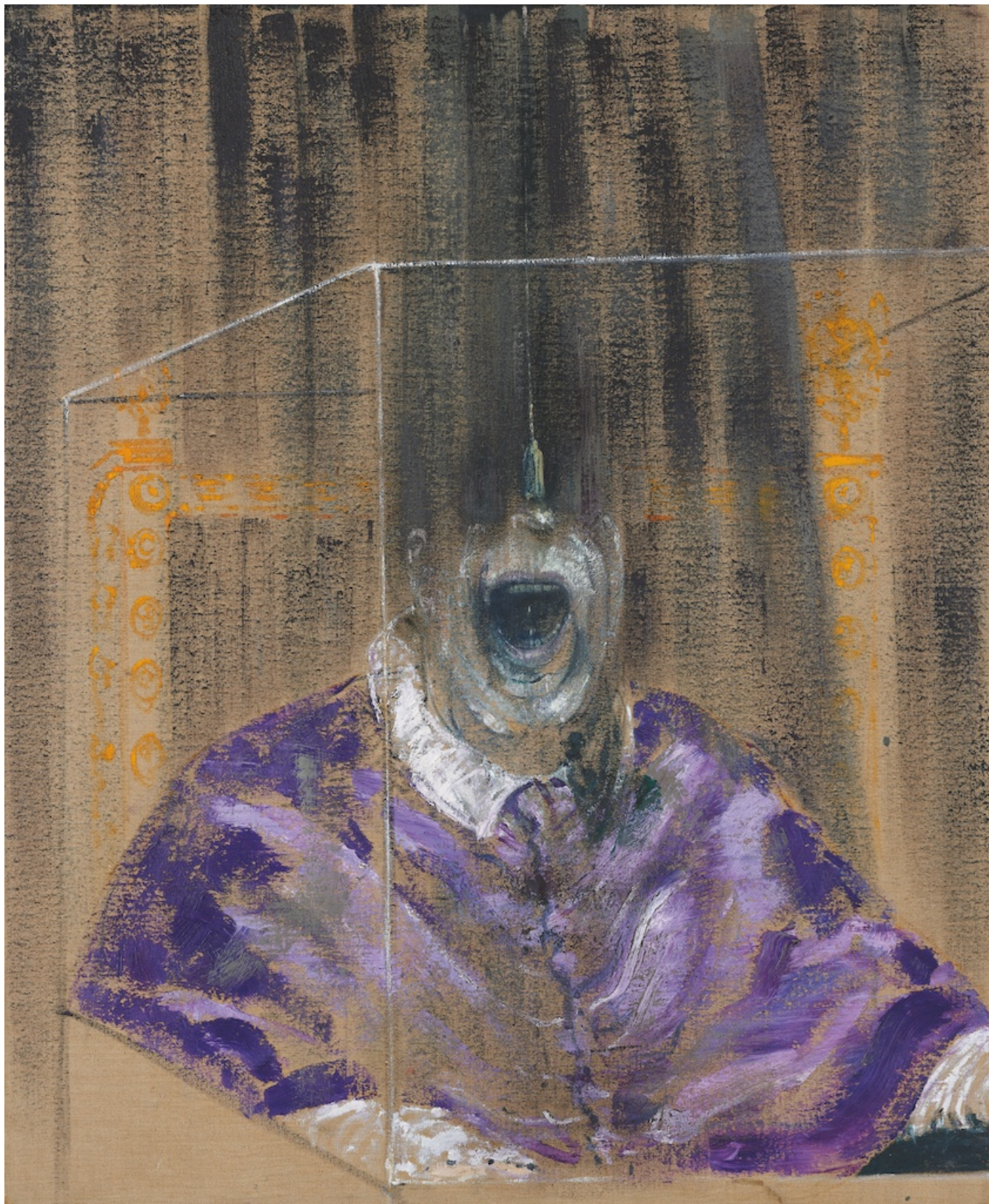
Фрэнсис Бэкон. Голова VI, 1949 г. Arts Council Collection, Southbank Centre, London © The Estate of Francis Bacon. All rights reserved / 2025, ProLitteris, Zurich

Фрэнсис Бэкон (1909-1992), считающийся одним из самых выдающихся художников XX века, был британцем, хоть и родился в Дублине: его отец, вышедший в отставку майор, и мать из семьи стальных магнатов, переехали туда, чтобы разводить лошадей. Истинно британское занятие! Как и определенный пуританизм: узнав о гомосексуальных наклонностях сына, майор Энтони Эдвард Мортимер Бэкон, в 1926 году выставил его из дома. О времена, о нравы! Куда было податься молодому