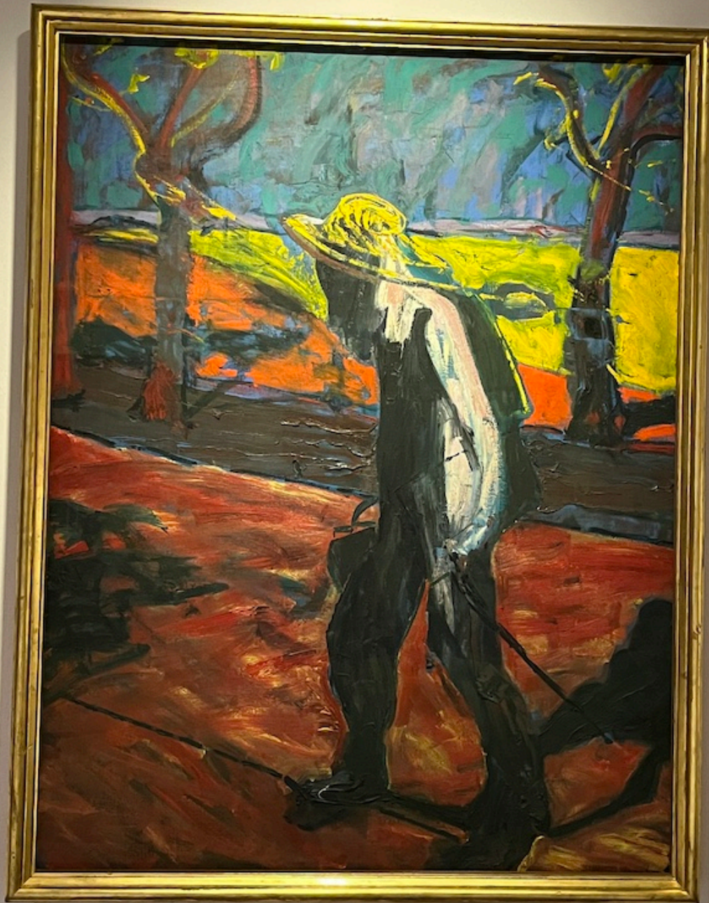
Фрэнсис Бэкон. Этюд к Портрету Ван Гога, 1957 г. Tate Gallery, offert par la Contemporary Art Society, 1958

Впрочем, и ранние его работы можно назвать «традиционными» лишь с большой натяжкой. Посмотрите на «Голову VI» (1949), в которой явный намек на «Крик»