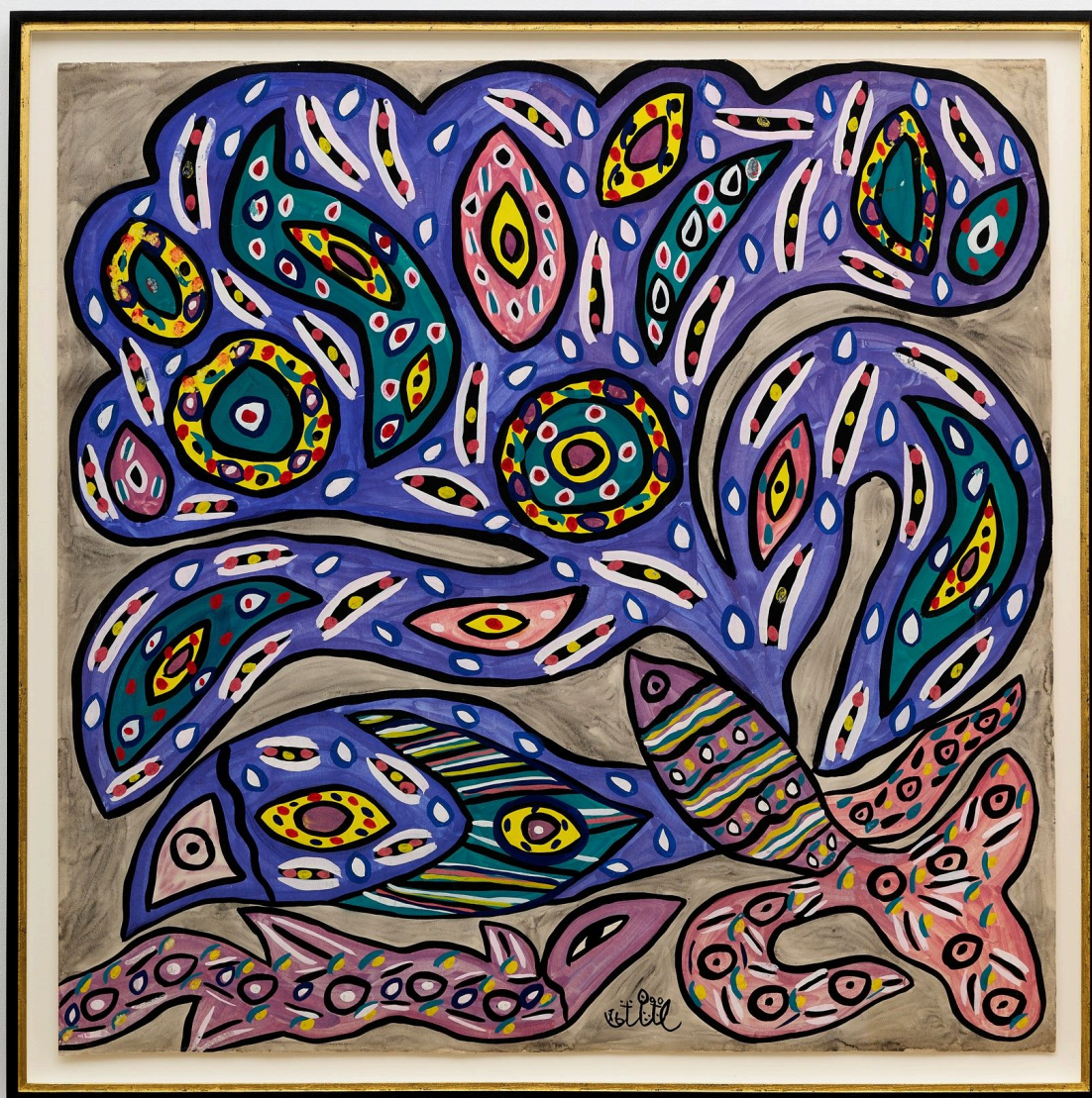
Байя. "Рассвет и рыба", 1976 г.